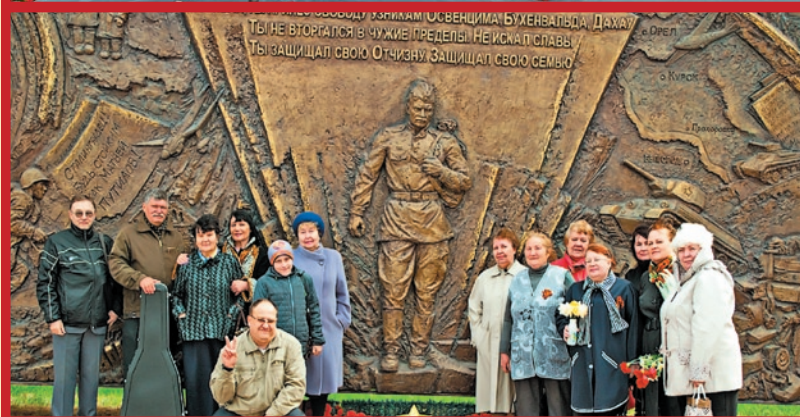
7.05.2016 г., г. Тюмень. Ассоциация «Поэты Тюменской области» у мемориала «Вечный огонь».