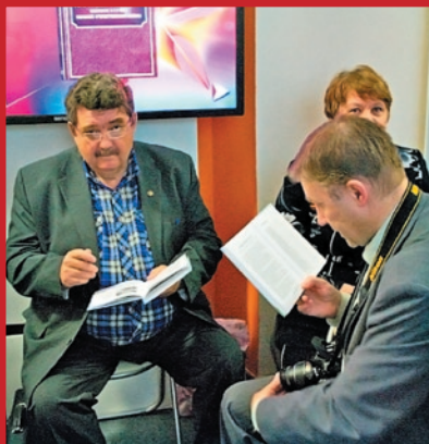
7.05.2016 г., г. Тюмень. Презентация литературно-поэтического альманаха «Поэзия земли тюменской» №15 в здании тюменского областного краеведческого музея «Городская Дума».