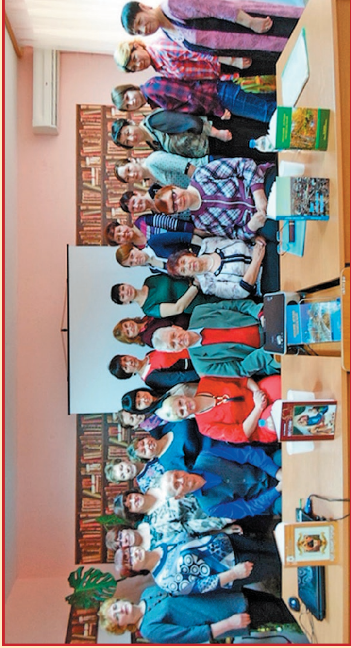
13.04.2016 г., с. Ярково. Встреча поэтов литературного объединения «Лад» с библиотекарями сельских поселений Ярковского района.