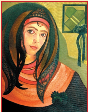
Память Афгана, 1990 г. ДВП, масло, 72x56.