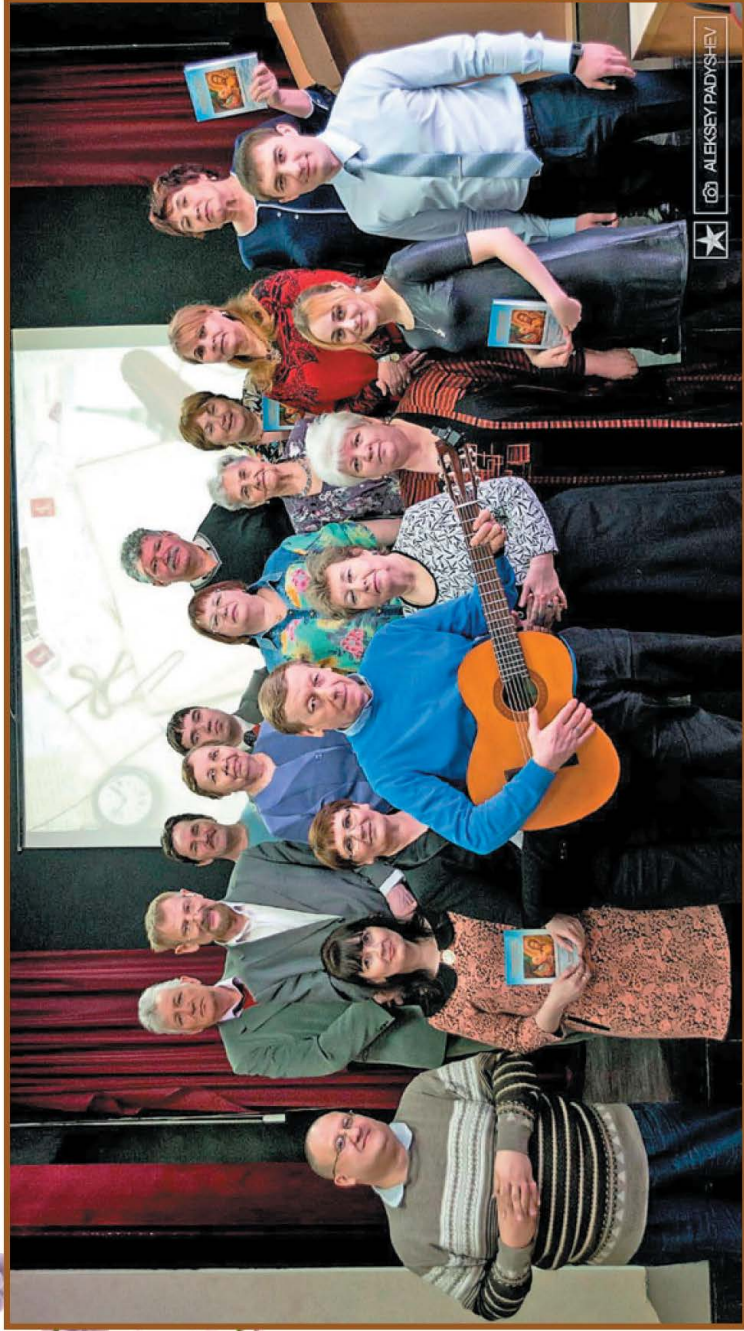
5.03.2016 г. Тюмень. Городской центр информационно-библиографического обслуживания молодежи. Презентация литературно-поэтического альманаха «Поэзия Земли Тюменской» №14