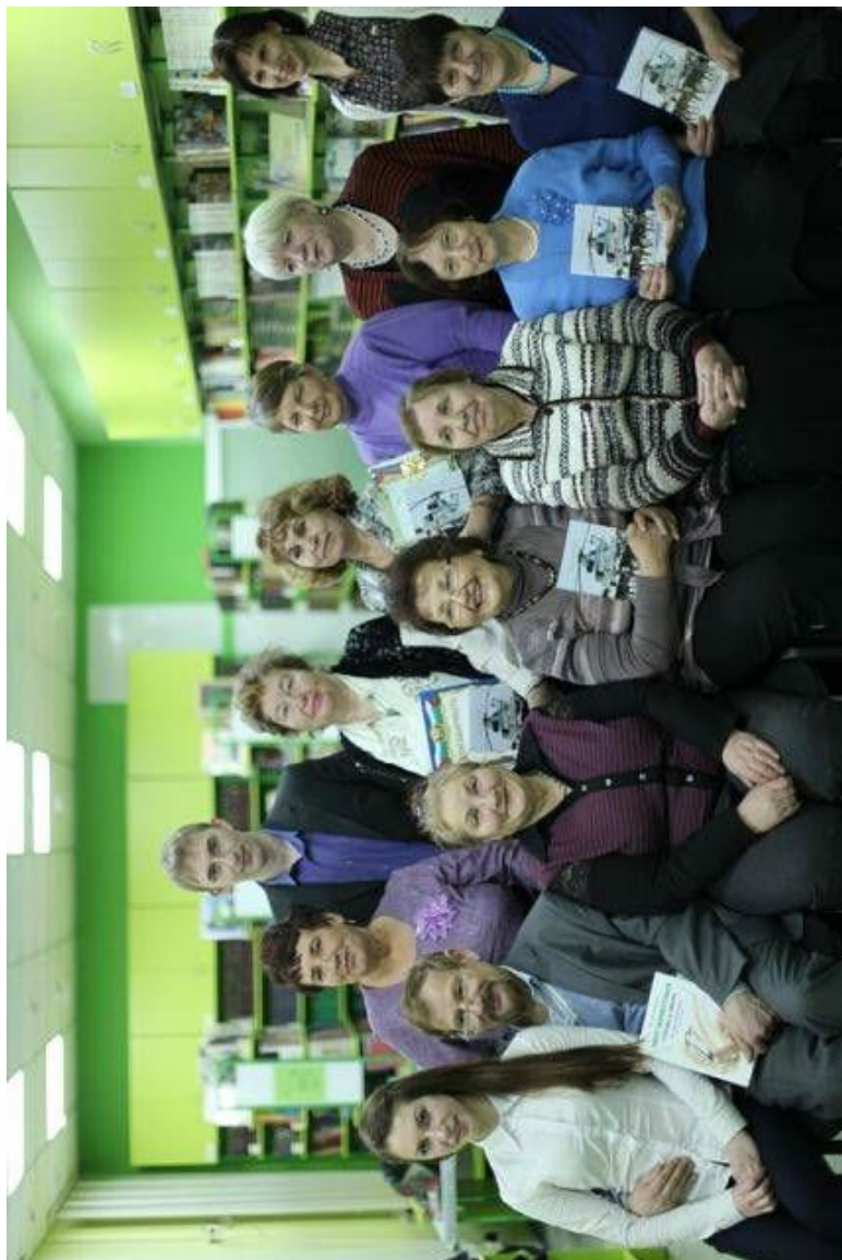
Презентация ЛПА №9 в библиотеке им. А.П.Чехова города Тюмени 6.12.2014г.