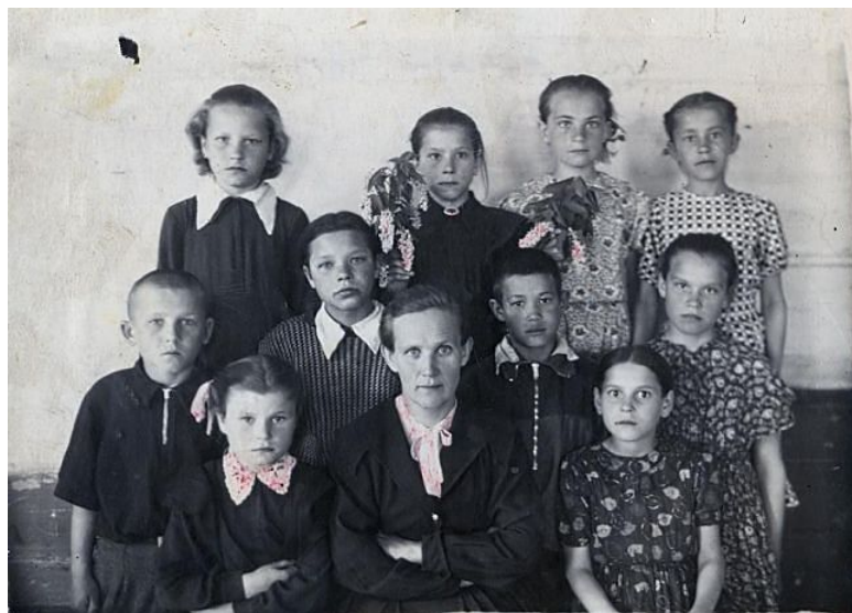
Хочу в Агалью!!!