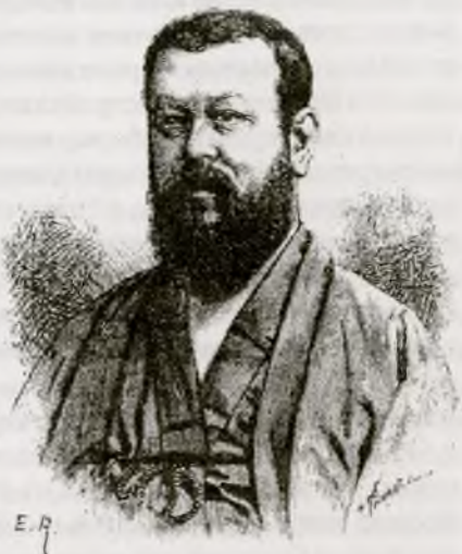
Эдмон Котто в японском облачении. Фото из книги Котто «Турист на Дальнем Востоке: Япония, Китай, Индокитай, Тонкин» (Paris, Hachette, 1884).

Около девяти часов утра, подкрепившись, соответственно русскому обычаю, несколькими стаканами чаю, я почитаю своим долгом осмотреть город. Выйдя из гостиницы, оказываюсь на берегу Туры. Обрыв, очень крутой, в двадцать пять метров высотой, вздымается над рекой, течение которой почти незаметно, так что сразу я не мог понять, в каком направлении она течет. Город Тюмень, основанный еще до начала русского заселения Сибири в 1580 году, ныне, с точки зрения промышленной и торговой, является важнейшим из городов Западной Сибири. Здесь есть за-