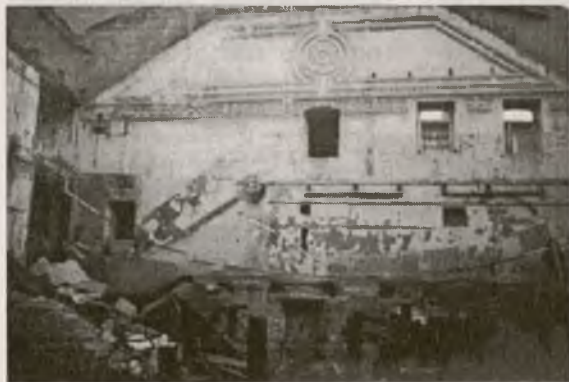
Руины старого здания синагоги (фото 90-х гг. XX в.)