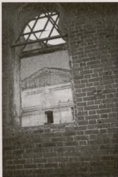
Синагога до реконструкции (фото 90-х гг. XX в.)