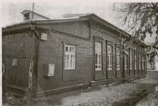
Так выглядел дом Альтшуллеров (вид с ул. Красина. Фото 90-х гг. XX в.)...

Альтшуллеры — одно из множества влиятельных тюменских семейств конца XIX — начала XX вв., о которых сегодня знают все, но в то же