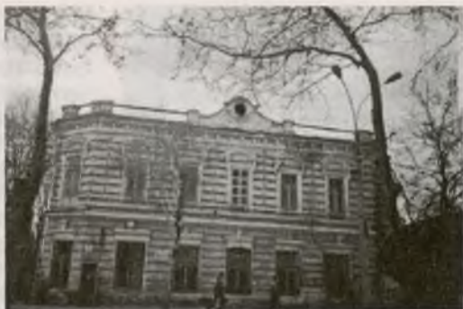
Дом на углу ул. Республики и Семакова: здесь проходили заседания ОЗЕТ