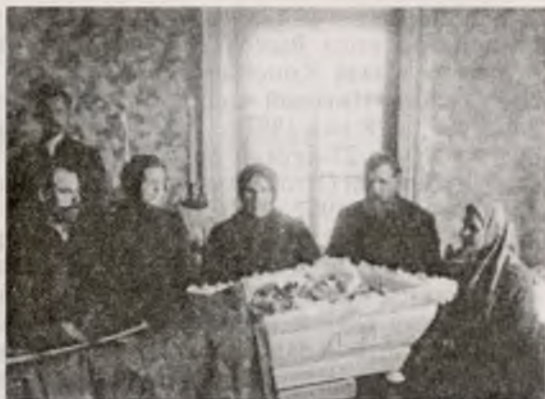
В последний путь

1874 год: «Причиной значительной смертности болезни: возрастных — чахотка, горячка и старость, а малолетних — понос и кашель».