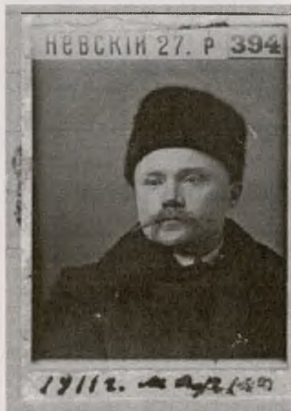
Абрамов Иван Спиридонович. Фото 1911 г. Ф. 1235. Оп. 1. Ед. пр. 22. Л. 1

Уже просмотрев описи с перепиской и отдав заявку на копирование, вспомнил свое ехидство в одном из материалов по поводу того, что рукопись М. Знаменского переписана рукой племянницы. Письма В.Д. Бонч-Бруевича