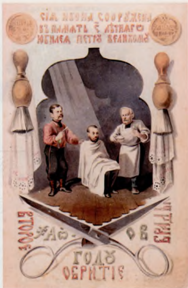
Второе обрיתіе браны. Акв. М.С. Знаменского