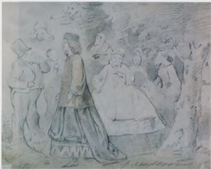
М.С. Знаменский. Лесные страхи