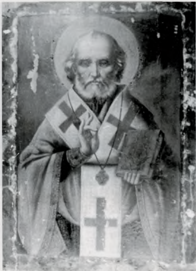
М.С. Знаменский. Икона «Николай Чудотворец»