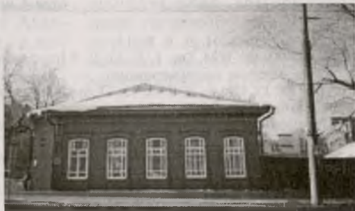
...на этом месте скоро вырастет еще один дом госуниверситета