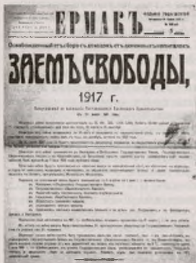
Сохранившиеся номера «Ермака» несут на себе печать времени...