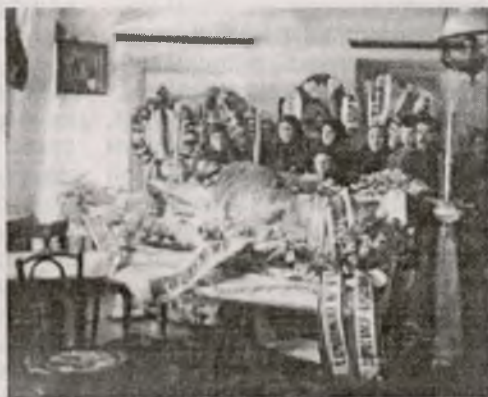
Похороны купца Мясникова. 1910 г.

Записи, не оставляющие сомнений в участии врача в составлении посмертного эпикриза, фиксировали смерть: от катара желудка, горячки, лихорадки, оспы, чахотки, водянки, коклюша, грижа, скарлатины, разрыва сердца, «от золотушного истощения», от рака, порока сердца, апоплексического удара, от золотухи, ревматизма, тифа, кори, скоротечной чахотки, горловой чахотки, брюшного тифа, от кровотечения, воспаления брюшины, сибирской язвы, «от энфлуэнции», «от воспаления мозговых оболочек», грудной жабы (старое название стенокардии), паралича сердца, паралича гор-