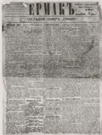
Цитатой из этого номера «Ермака» начался наш рассказ о газете...

Избрание городского головы предreshено. Им будет