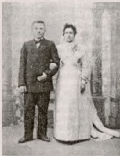
Новобрачные. Фото кон. XIX в.

В метрических книгах можно встретить записи, когда у