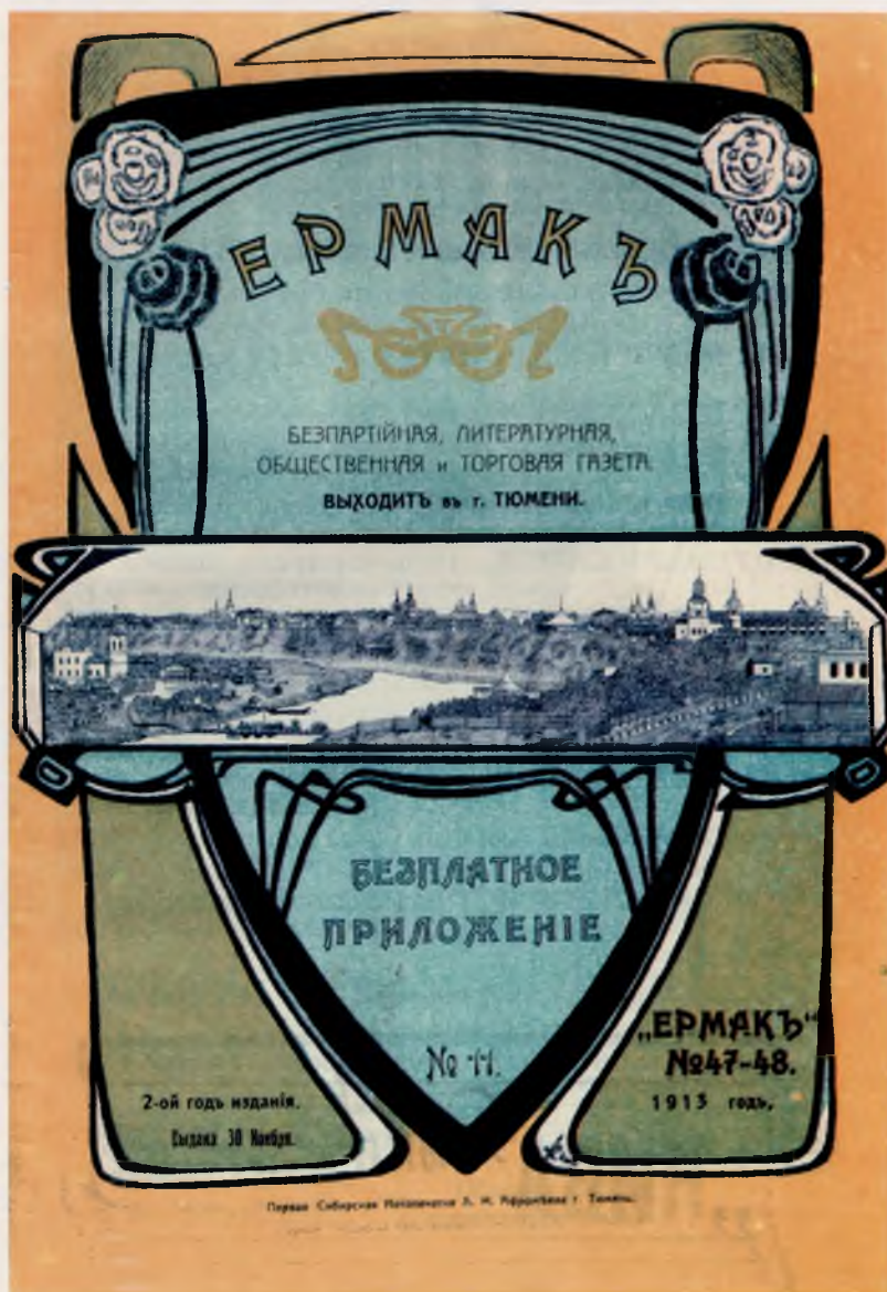
Обложка бесплатного приложения к газете «Ермак». 1913. №11