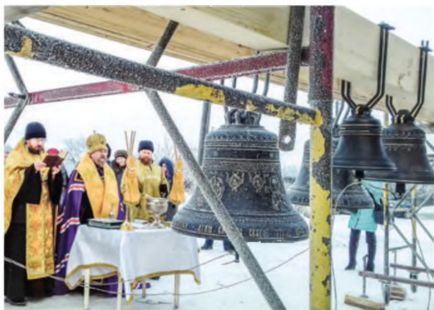
Шуваловские колокола не отличаются по звуку от старинных и «звучат» сегодня по всей России. К примеру, в Московском Кремле на колокольне Ивана Великого