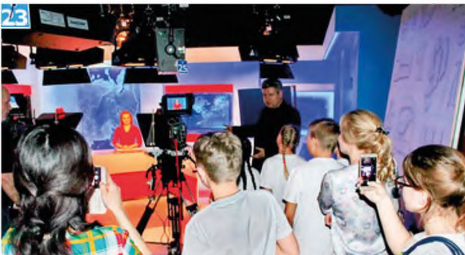
Студия «Сверчок» в гостях у коллег. Телерадиокомпания «Регион-Тюмень». 2018 год