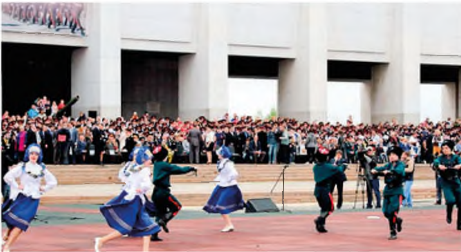
Карасульцы выступают на Поклонной горе. 2020 год