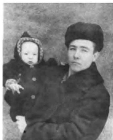
С отцом. 1952 год