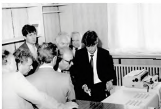
Начальник НГДУ «Урвенефть». 1985 год