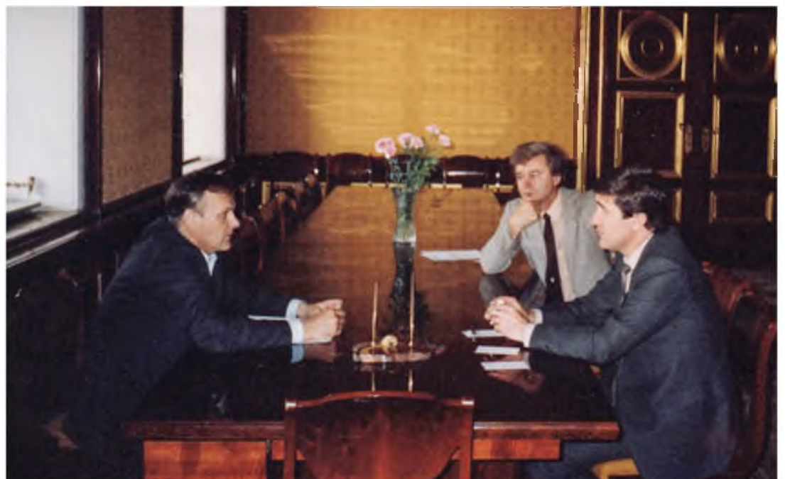
Обсуждение с Анатолием Александровичем Собчаком — мэром города Ленинграда — договора об экономическом сотрудничестве с Тюменской областью. Июль 1990 года