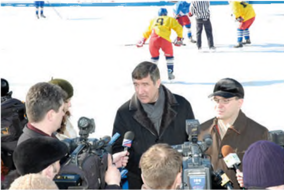
На открытии плавательного бассейна. Карасуль, 2006 год