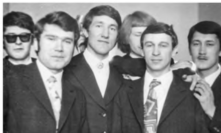
Студент ТИИ. 1973 год