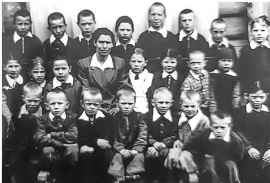
Первый класс Карасульской начальной школы. Второй сверху слева — Юра Шафраник. 1960 год