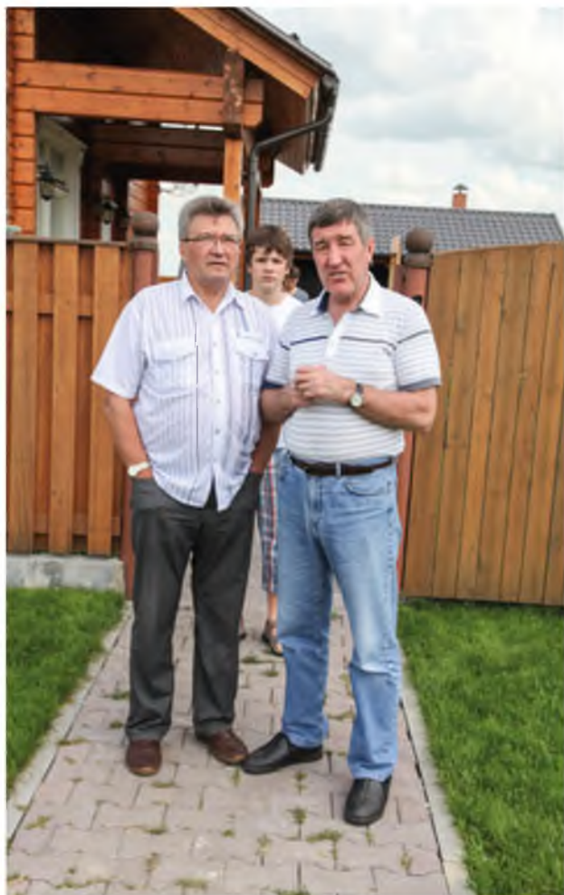
Карасуль. В отцовском доме