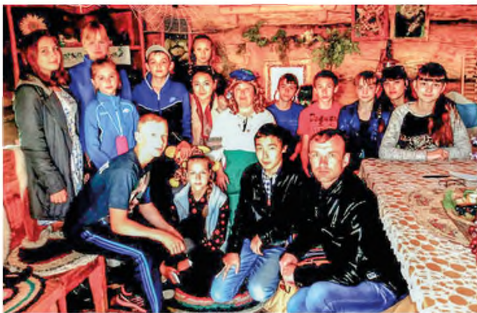
Юные карасульцы в Тобольске. 2015 год