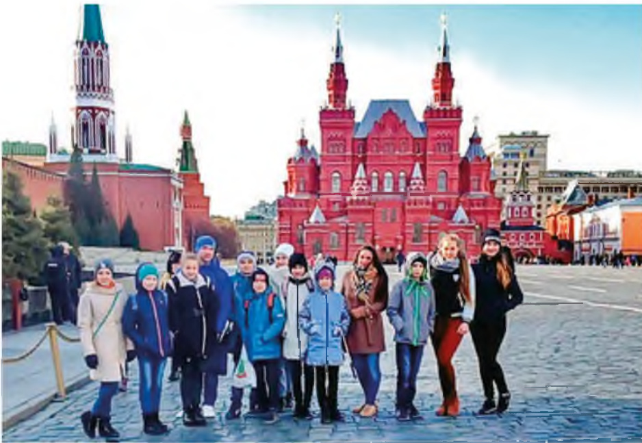
Юные карасульцы в Москве. 2017 год