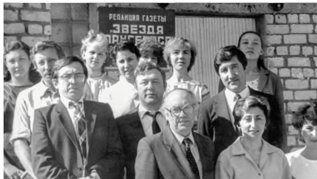
Второй секретарь Лангепасского горкома КПСС. 1986 год