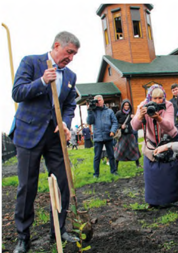
На освящении храма в селе Карасуль после реконструкции. Август 2019 года