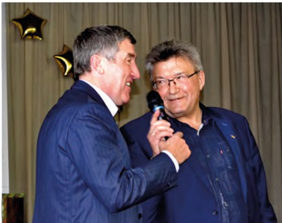
Общий язык земляков, рожденных в феврале

Королевский, царский, государственный. В экономике земельного права «роялти» означает рентную плату за право разработки природных ресурсов. Но собственнику недр платит тот, кто их разрабатывает. С тюменскими роялти как раз все наоборот. Собственник недр делится солидной долей с трудящейся территорией. Тюменское роялти — особая статья. Начинается с «царского» указа первого президента России.