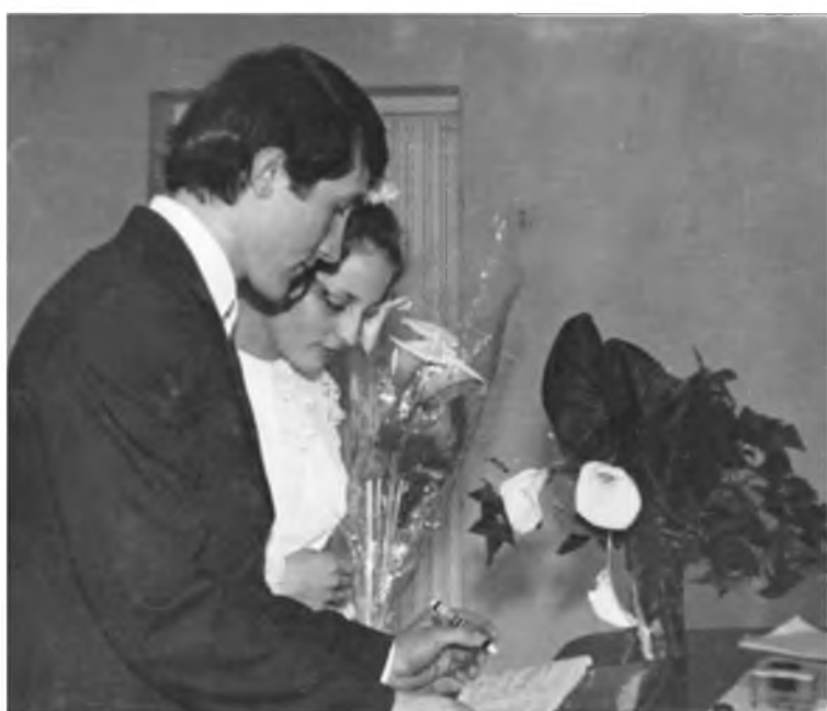
Роспись в загсе. Март 1974 года