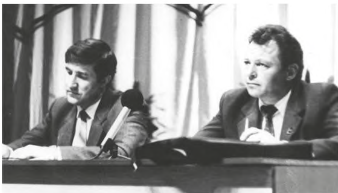
Генеральный директор «Лангепаснефтегаза». 1989 год