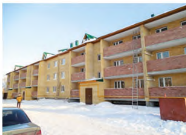
Строительство 45-квартирного дома для переселения