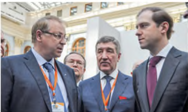
На Форуме горнопромышленников России. 2018 год