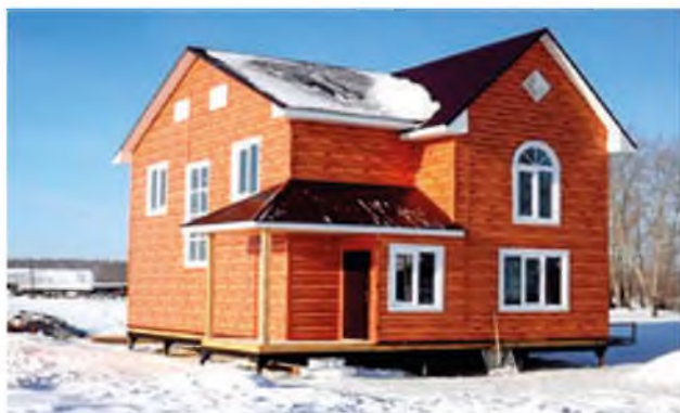
Строительство жилья для молодых специалистов