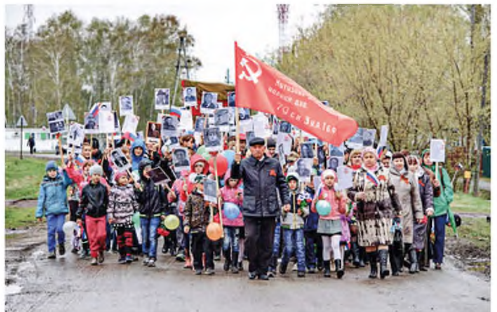
Бессмертный полк. 9 Мая 2015 года