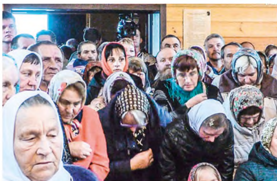
Прихожан встречают золотистые деревянные стены, здесь тепло благодаря новым технологиям и солнечно круглый год от сияющих ликов святых, бликов горящих свечей и светильников. Каждая деталь обустроена с любовью и благостью