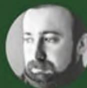
Автор текстов Дмитрий Падерин