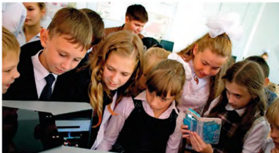
3D-принтер — подарок школьникам от фонда к 1 сентября. 2016 год

Карасуль готовится к знаменательной дате — 250-летию. Фонд совместно с администрацией поселения реализует ряд мероприятий. В том числе 17 мая 2014 года рядом с Центром досуга заложен сквер, высажены саженцы рябины, жасмина и тополя.