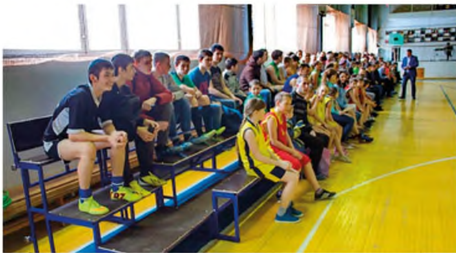
Смонтированы новые сборно-разборные трибуны в спорткомплексе «Карасульский». 2016 год