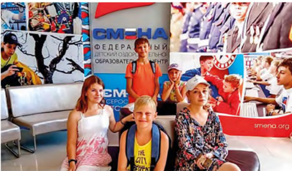
Студия «Сверчок» на Черном море. 2017 год