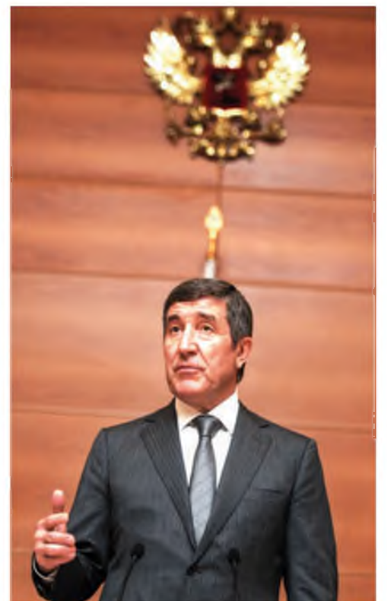
Выступление в Государственной Думе РФ. 2013 год