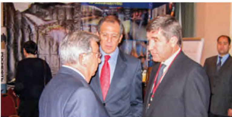
С С. В. Лавровым и Е. М. Примаковым на международной конференции. 2004 год