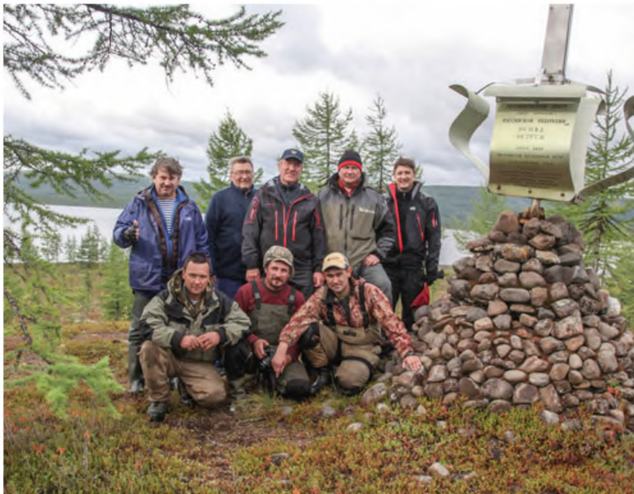
Географический центр России — озеро Виви. Цивилизация тишины