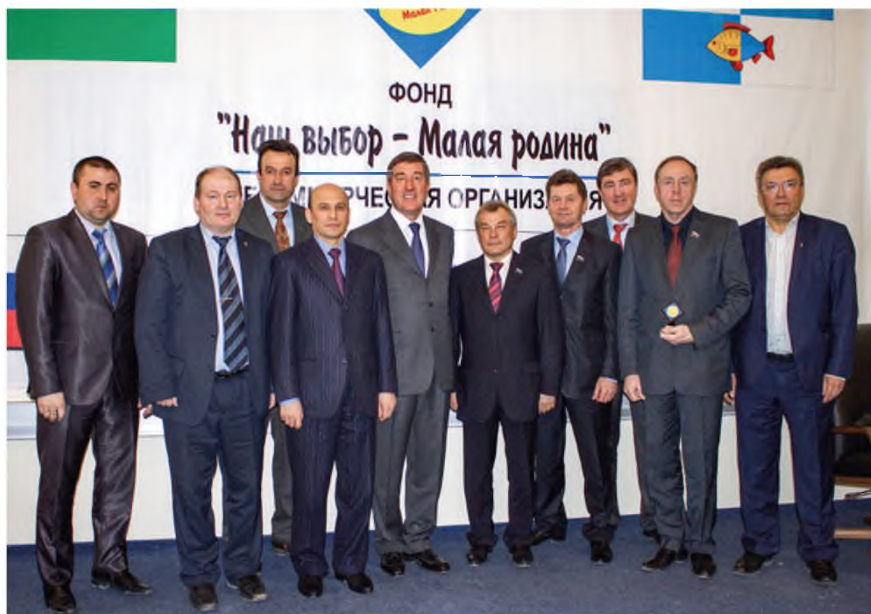
Члены попечительского совета фонда «Наш выбор — Малая Родина». Село Карасуль, 2014 год

Такая схема взаимоотношений нашла развитие и в дальнейшем. Например, в 1993 году в проекте Конституции мы прописали, что автономный округ имеет право на федеральный именной закон, что автономный округ входит в состав края или области, их отношения регулируются федеральным законом или договором между органами власти. Также в развитие этих принципов в 2005 году был принят закон (а на сегодняшний день в новой уже редакции) об общих принципах организации публичной власти в субъектах Российской Федерации. То есть федеральный центр вновь согласился с той формулой взаимоотношений, сформировавшимся механизмом согласования своих намерений и действий, которые были предложены еще в 90-е годы Юрием Константиновичем Шафраником.