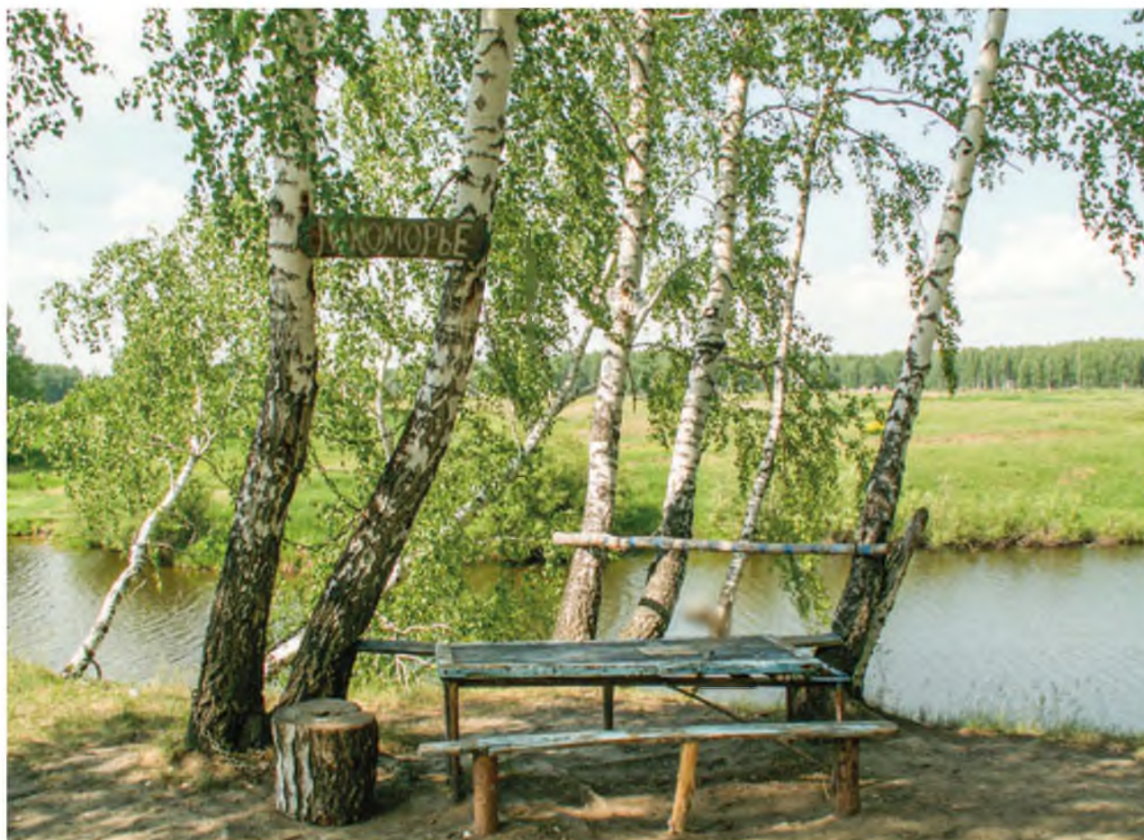
На берегу реки Карасуль