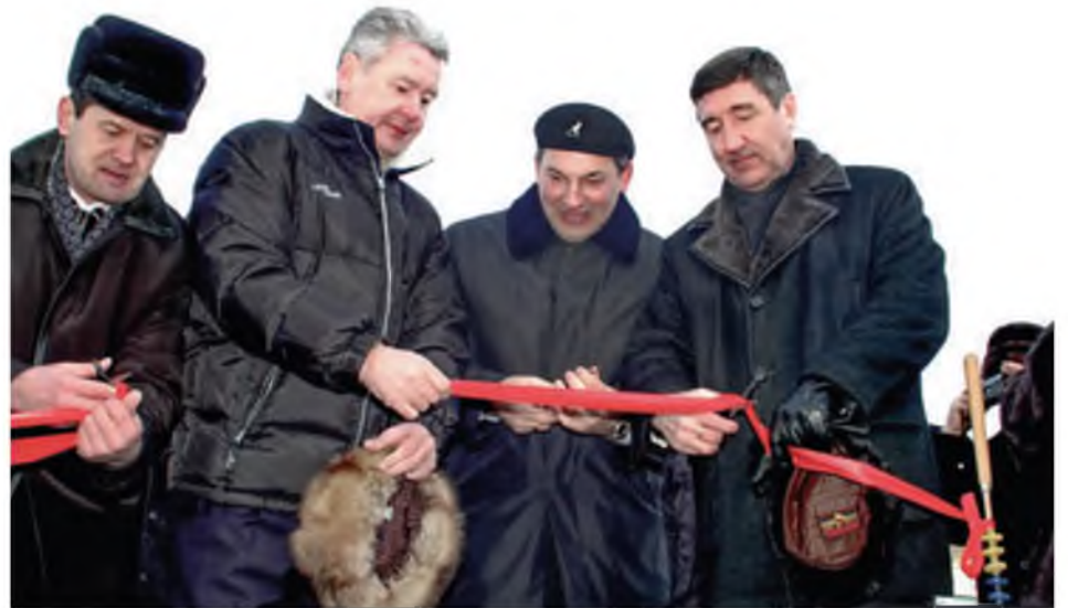
Открытие Карасульского спорткомплекса. 5 марта 2005 года