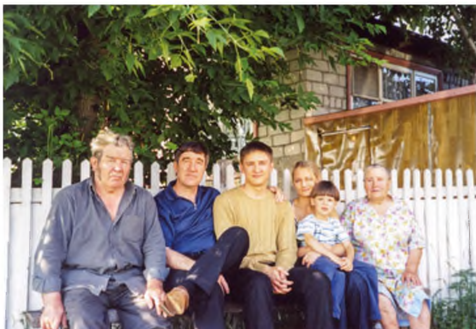
У родного дома. Карасуль, 2011 год