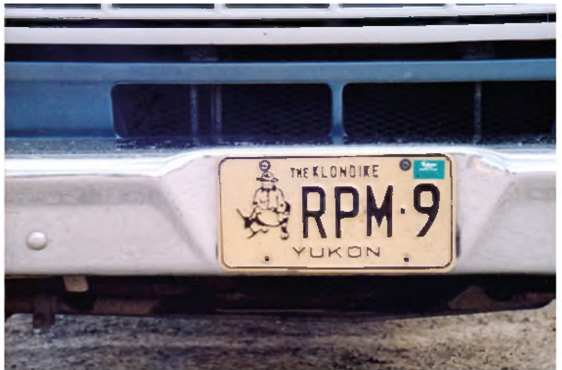
Крайняя точка нашего путешествия по Канаде — Клондайк. Осень 1990 года