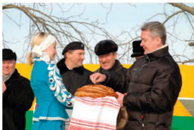
Открытие Карасульского спорткомплекса. 5 марта 2005 года