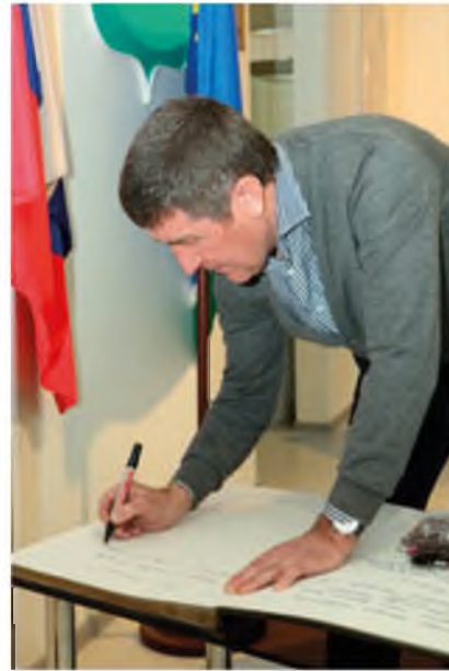
Запись в книге почетных гостей музея. Лангепас, март 2012 года