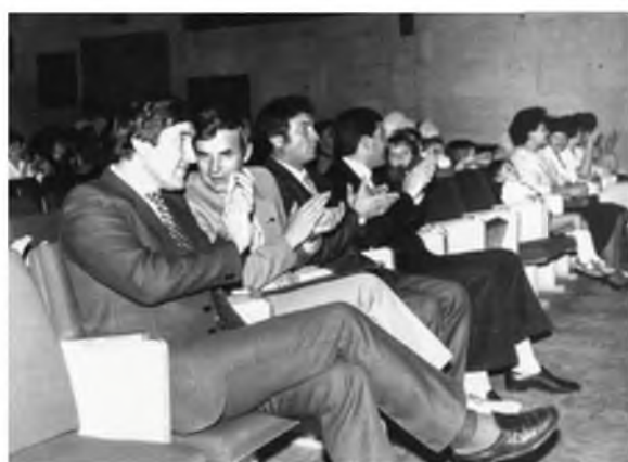
Генеральный директор «Лангепаснефтегаза». 1990 год