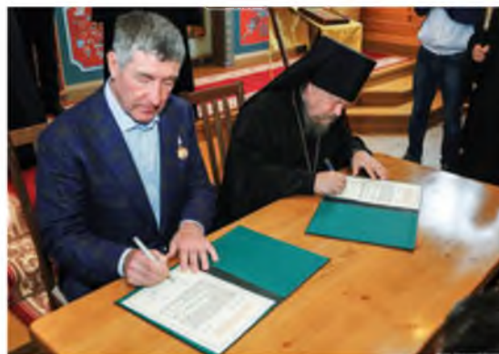
Подписание акта о завершении реконструкции храма в селе Карасуль. Август 2019 года