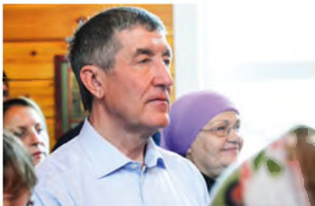
В храме села Карасуль. Август 2019 года

— Возможно, я покажусь нескромным (смеется), но из кутерьмы и трагизма, которые царили в тот