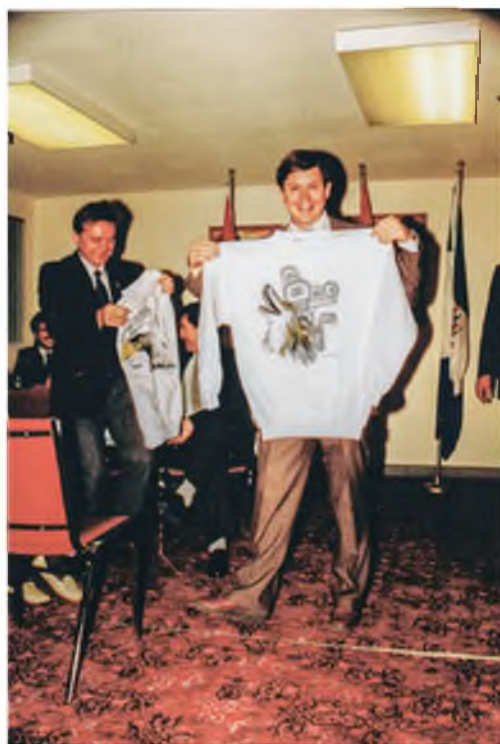
Посещение ведущего колледжа в Уайтхорсе