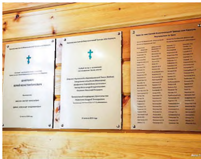
Имена главного мецената Ю. К. Шафраника и всех жертвователей на реконструкцию запечатлены на благодарственных досках на стенах церкви