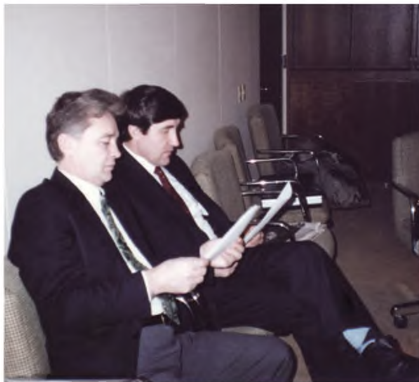
В. П. Мельников и Ю. К. Шафраник. 1992 год