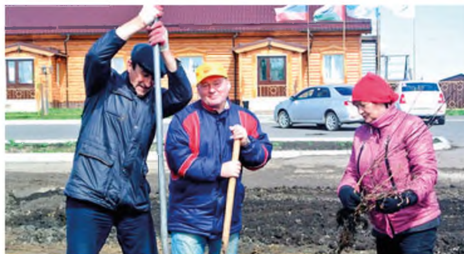
Закладка сквера возле Центра досуга. 2014 год