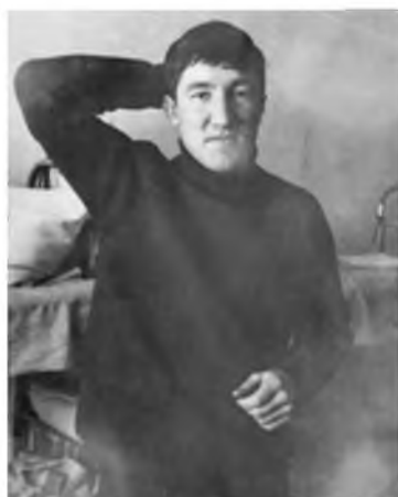
Выпускник ТИИ. 1974 год