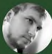
Автор текстов Дмитрий Лихарев