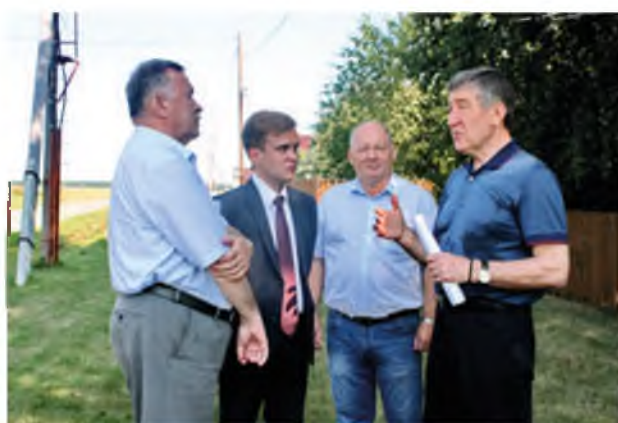
На праздновании 250-летия села Карасуль. 2015 год