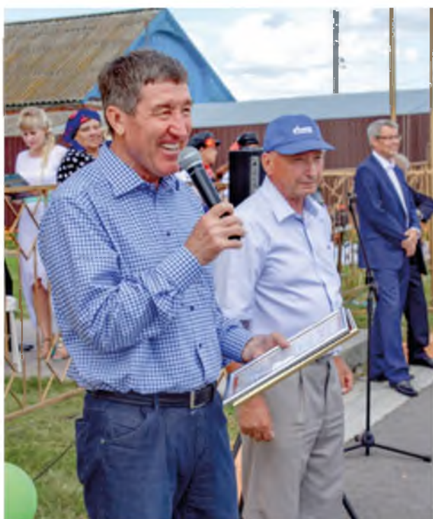
На праздновании 250-летия села Карасуль. 2015 год