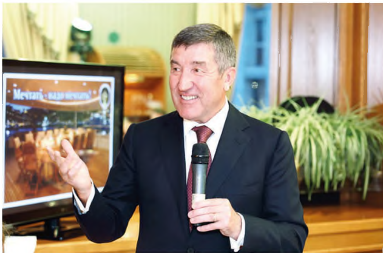
Выступление перед инженерной общественностью компании «ЛУКОЙЛ». Москва, 2013 год