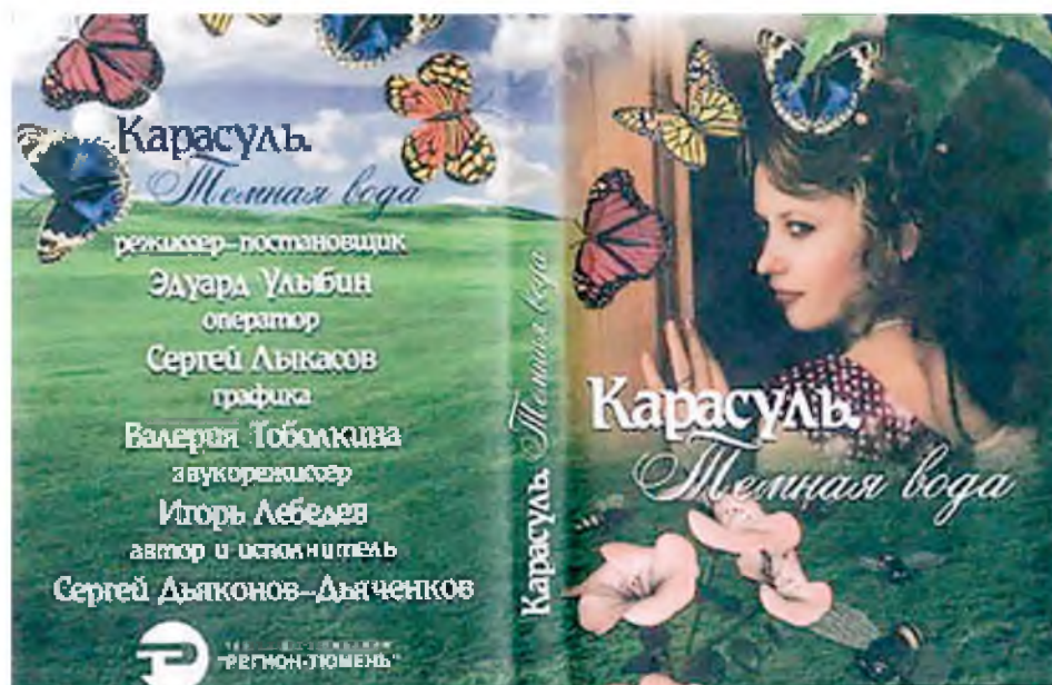
Компакт-диск с записями коллективов самодеятельности сел Ишимского района. 2006 год