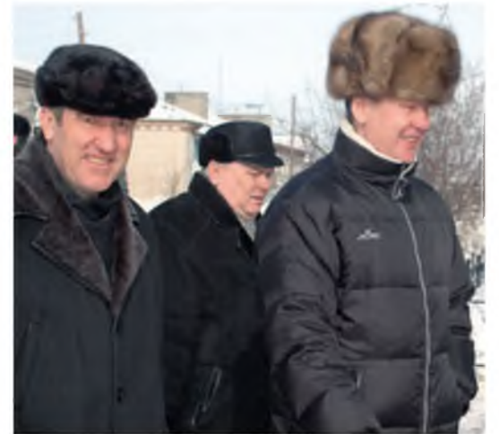
Открытие спортивного комплекса в Карасуле. Март 2005 года