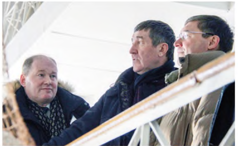
Открытие плавательного бассейна. 13 марта 2006 года

Запускаем еще один проект, называется «Гусеферма». В рамках этого проекта выкупили усадьбу, где теперь частник занимается разведением птицы в большом