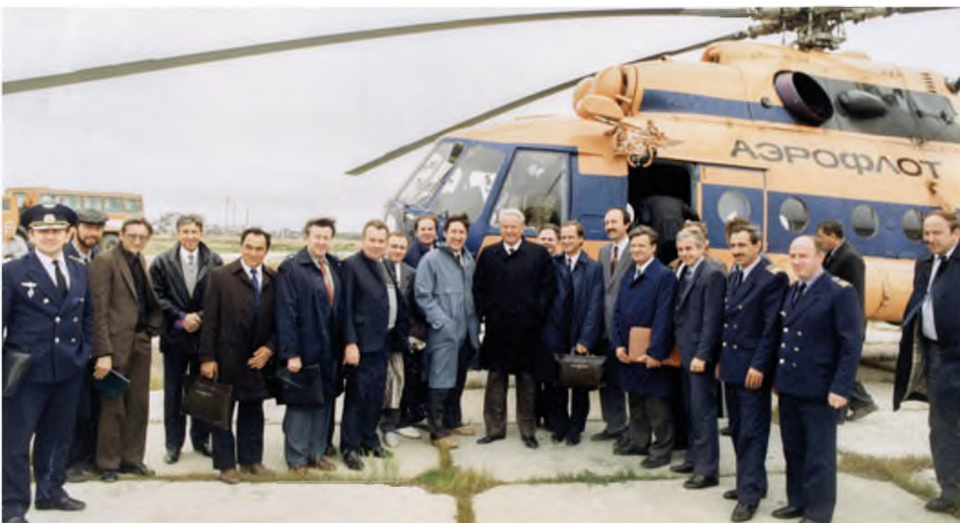
Посещение Тюменской области Президентом РФ Б. Н. Ельциным. 1991 год