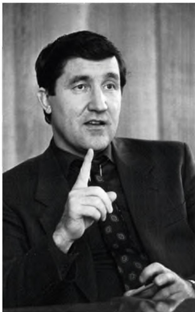
Генеральный директор «Лангепаснефтегаза». 1987 год