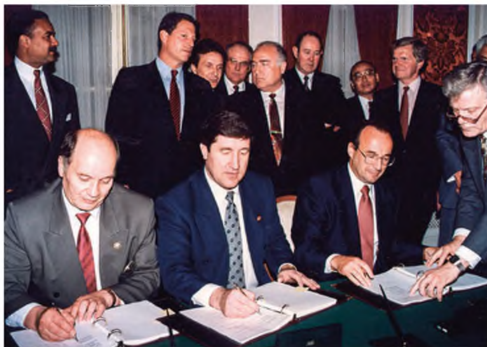
Подписание документов новых стратегических направлений отрасли

Наша коллективная позиция — продолжать отстаивать идею жесткого контроля по стратегическим вопросам развития ТЭК на президентском уровне, идею образования профессионального Совета при Президенте Российской Федерации.