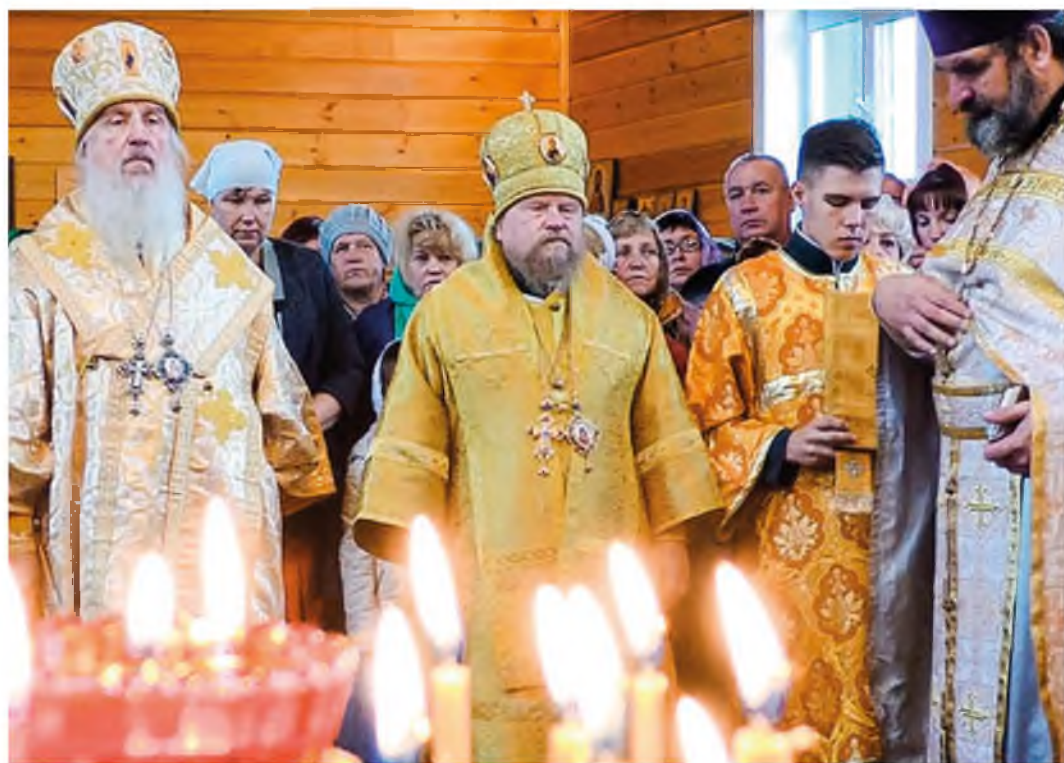
Первый молебен в открытом после реставрации храме. Митрополит Тобольский и Тюменский Димитрий и епископ Ишимский и Аромашевский Тихон