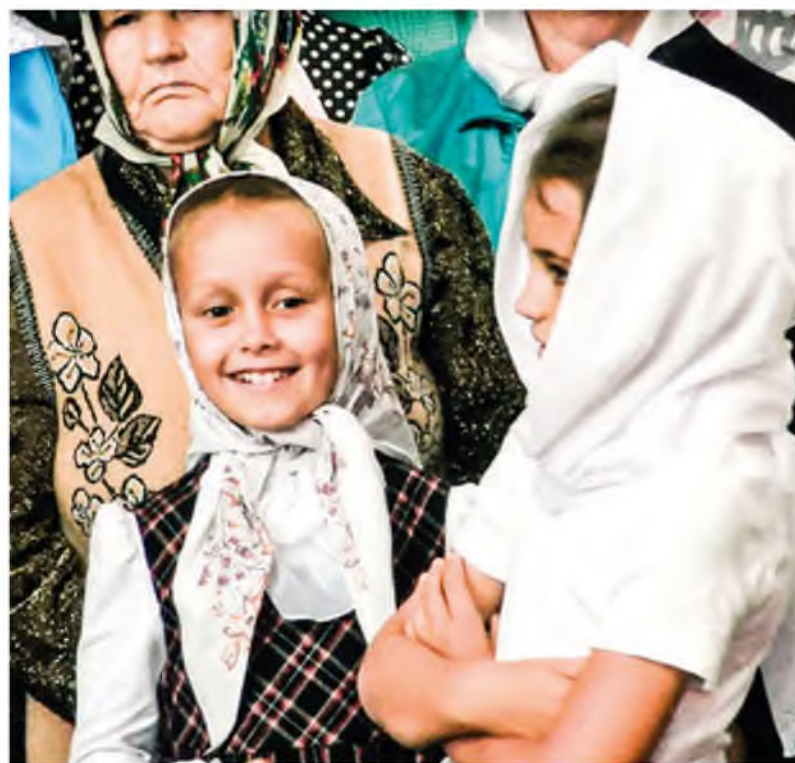
Охотно и радостно посещают служения не только люди старшего поколения, но и дети