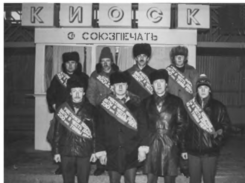
С участниками Почетной вахты. Лангепас, 1987 год