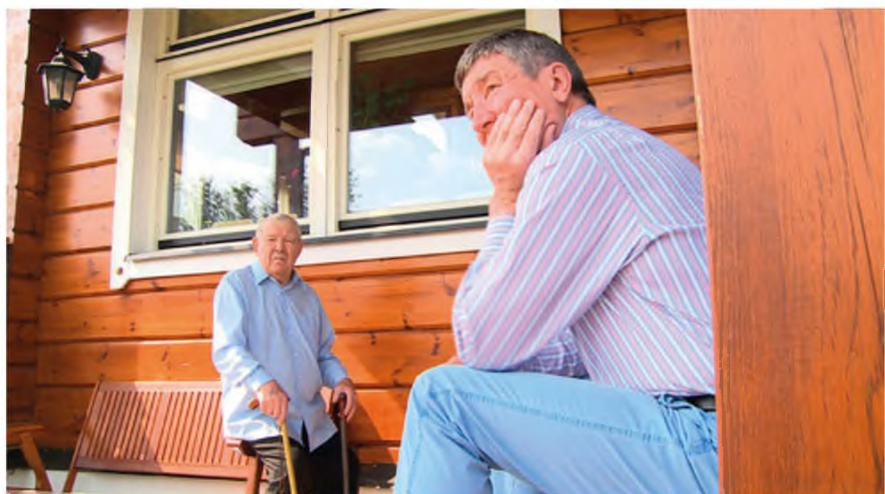
На крыльчке с отцом. Село Карасуль, 2013 год