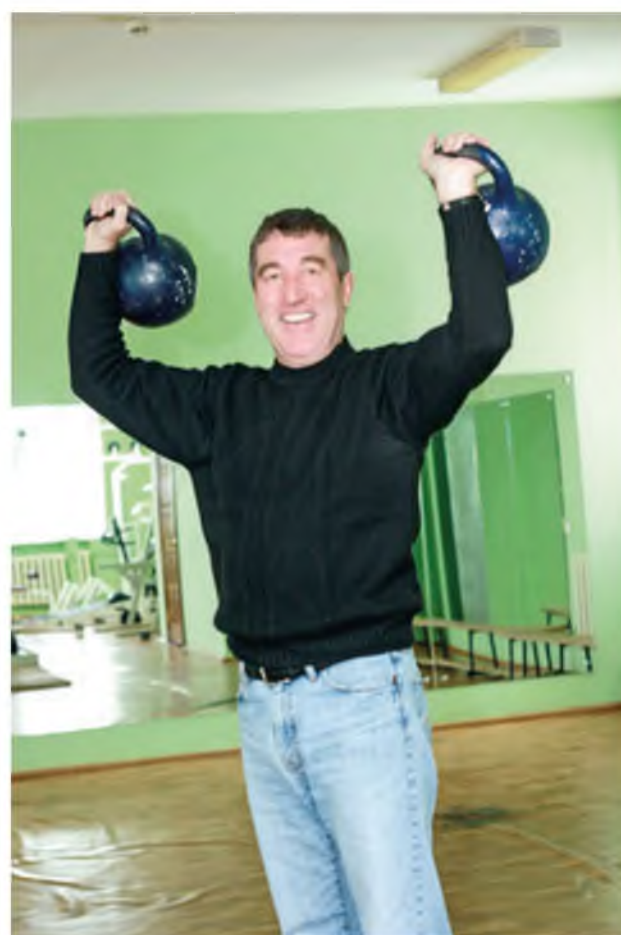
В спортивном комплексе села Карасуль. 2011 год