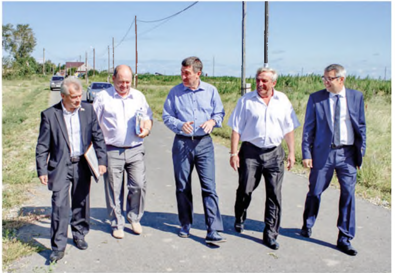
Члены попечительского совета фонда «Наш выбор — Малая Родина». Село Карасуль, 2017 год