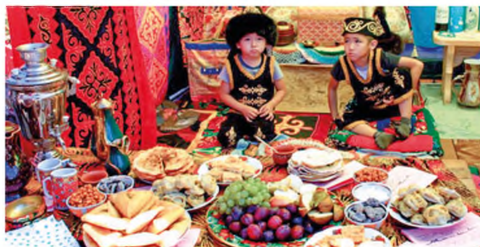
Празднование 250-летия Карасуля. Гостей встречали богатым столом