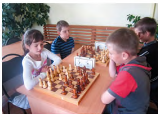
В Карасульском спорткомплексе