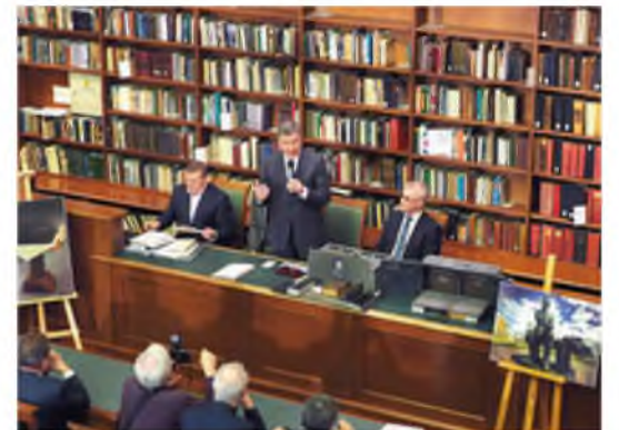
Презентация издания «Евангелие Достоевского». Ноябрь 2017 года