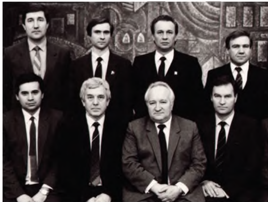
Они создавали Союз нефтепромышленников

Мне хотелось бы отметить с некоторым чувством удовлетворения: во властных структурах зреет понимание, что со специалистами обязательно надо советоваться, перед тем как принять то или иное решение, понимание целесообразности рыночного хозяйствования при государственном регулировании, обеспечивающем и формирование, и функционирование цивилизованного рынка, и гаран-