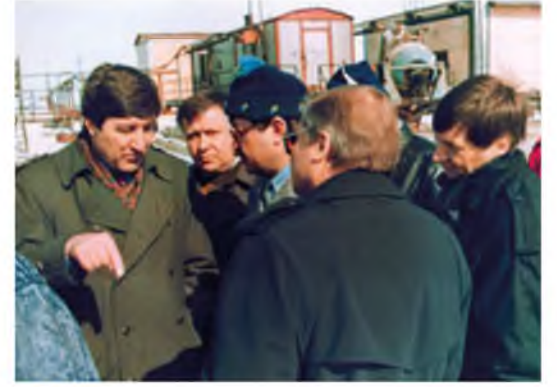
Министр Ю. К. Шафраник, рабочая поездка на промысел в Коми. 1993 год