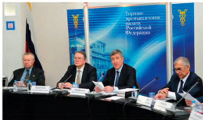
На заседании Комитета ТПП РФ. Март 2019 года