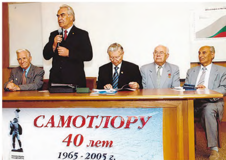
На научно-практической конференции

Об итогах нашей работы. Союз активно продолжает строить свою политику в направлении корпоративной консолидации усилий всех компаний на главных, стратегических вопросах. Хочется заметить, что именно сейчас Союз имеет очень сильную в профессиональном плане политическую роль и задачу. Позиция СНП пользуется политическим и профессиональным авторитетом. В немалой степени этому способствовало то, что Союз нефтегазопромышленников России сегодня активно сотрудничает с Торгово-промышленной палатой России, Российским союзом промышленников и предпринимателей, коллегами из отраслевых общественных объединений и организаций, отраслевыми профсоюзами.