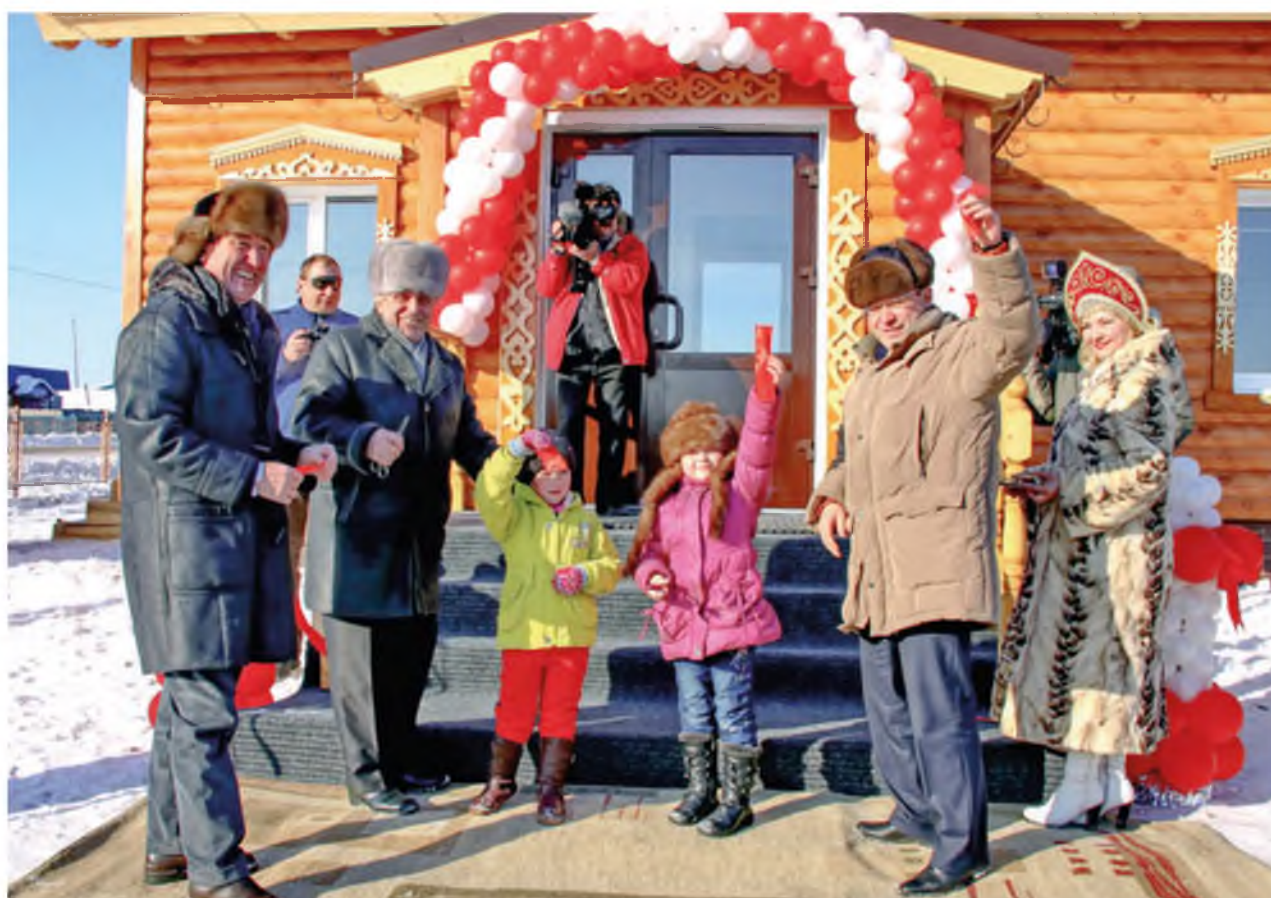
Открытие Центра досуга в селе Карасуль. 17 февраля 2012 года