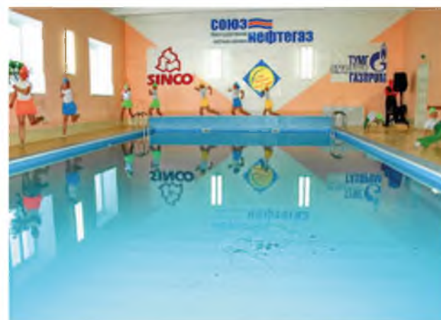
В бассейне Карасульского спорткомплекса