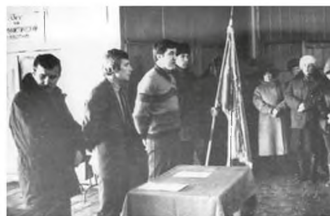
Вручение переходящего Красного знамени. Лангепас, 1988 год