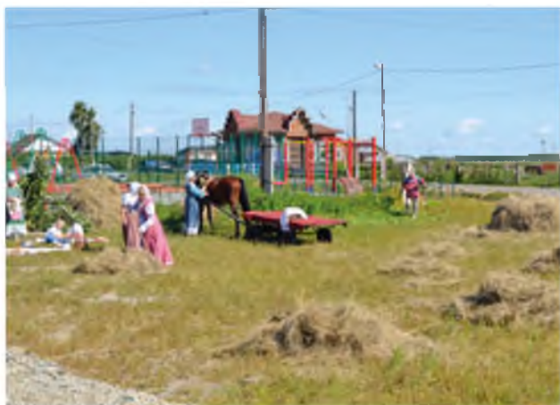
Праздничный флешмоб «Сенокос» к 250-летию села Карасуль