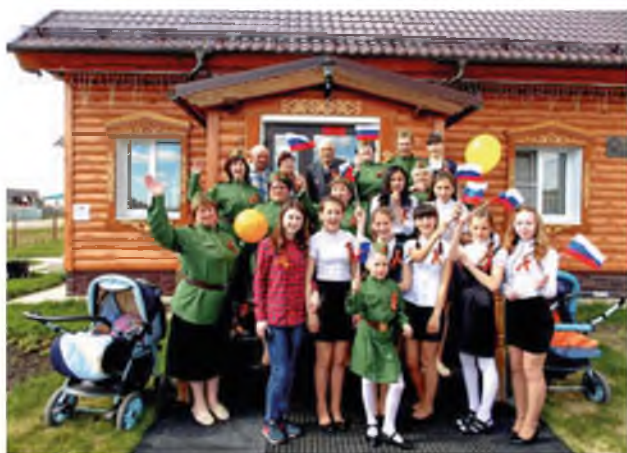
Празднование Дня Победы. Село Карасуль, Центр досуга