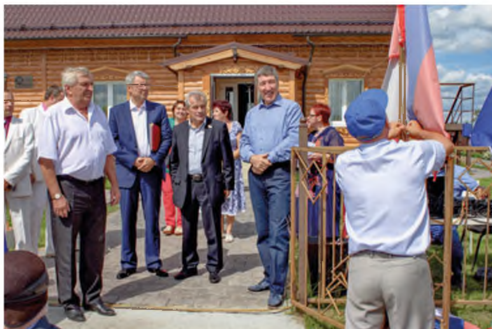
День села Карасуль. Июль 2015 года