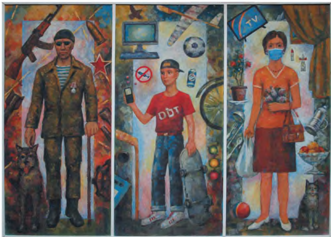
«Россия 2020-х». 2022 г. Оргалит, акрил. 78 x 112