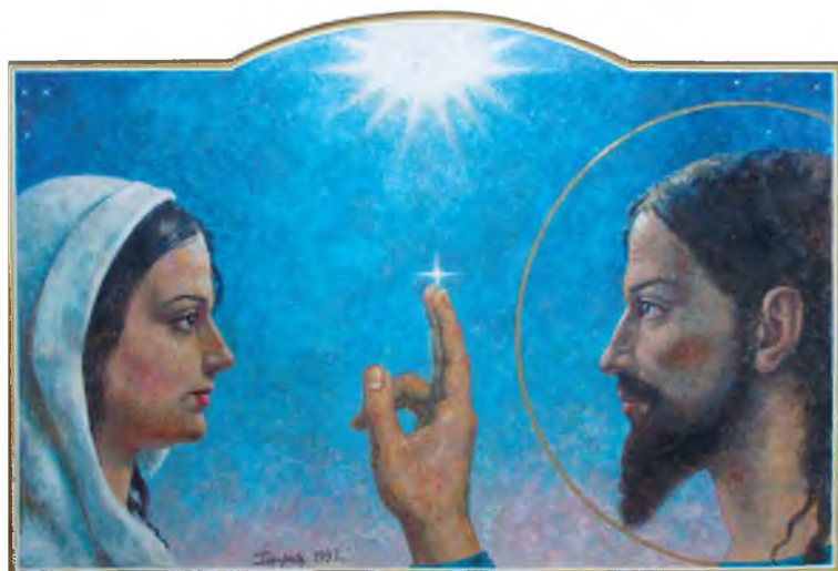
«Христос и Мария Магдалина». 1997 г. Бумага, гуашь. 35 x 52