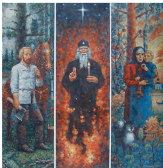
«Голоса предков». 2002 г. Холст, масло. 116 x 116