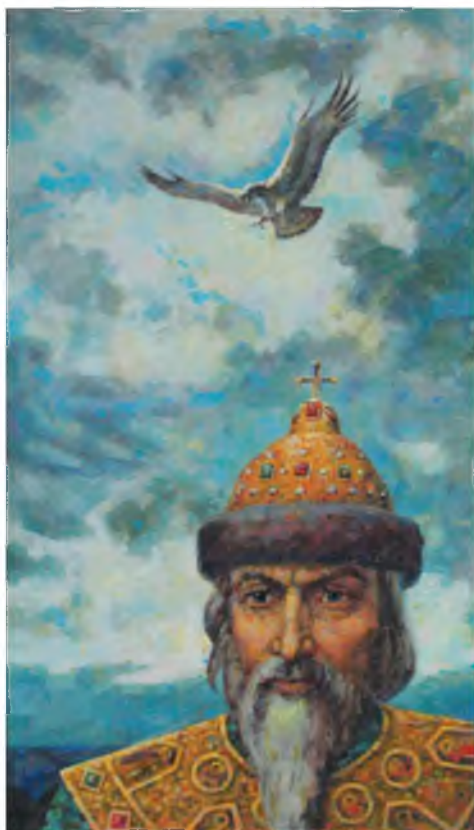
«Две Империи». 2016 г. Диптих. Левая часть «И.В. Сталин». Оргалит, акрил. 80 x 46 Правая часть. «Иван Грозный». Оргалит, акрил. 80 x 46