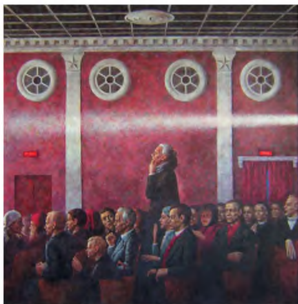
«Военная кинохроника («Алексей!»)». 1975 г. Холст, масло. 150 x 150