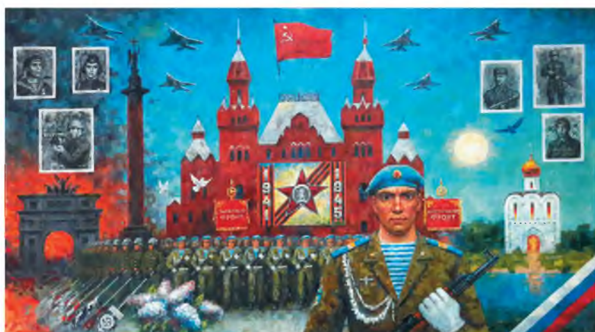
«День Победы». 2017 г. Оргалит, акрил. 98 x 153