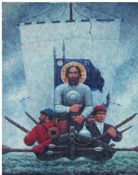
«Ермак». 1975 г. Холст, темпера. 135 x 110