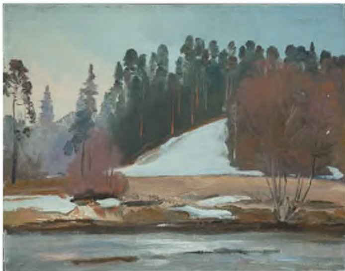
«Оредеж у Белогорки». 2008 г. Холст, масло, 46х60 Из собрания художника, Санкт-Петербург