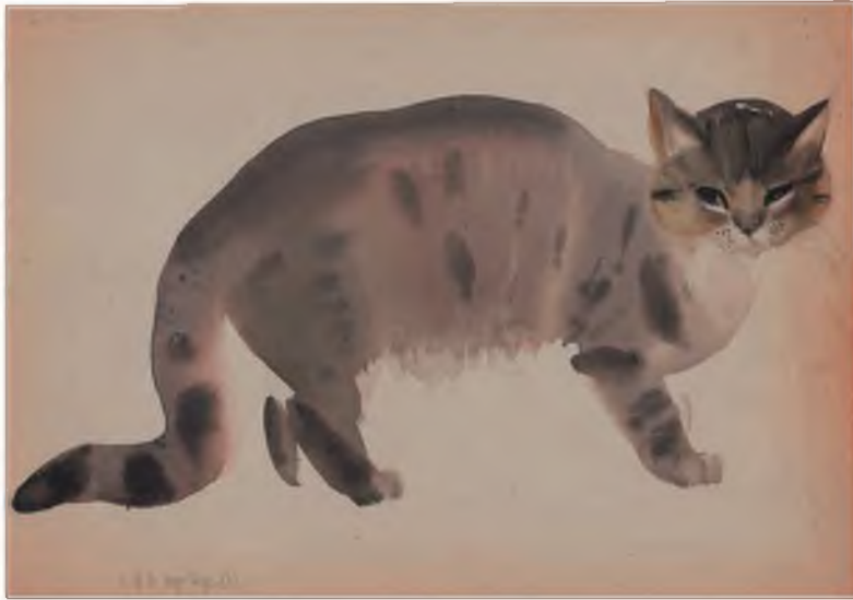
«Кошка». Бумага, акварель

А.Г. Траугот. Из серии «Мои любимые животные». 1950-е Бумага, акварель Из собрания А.Г. Траугота, Санкт-Петербург