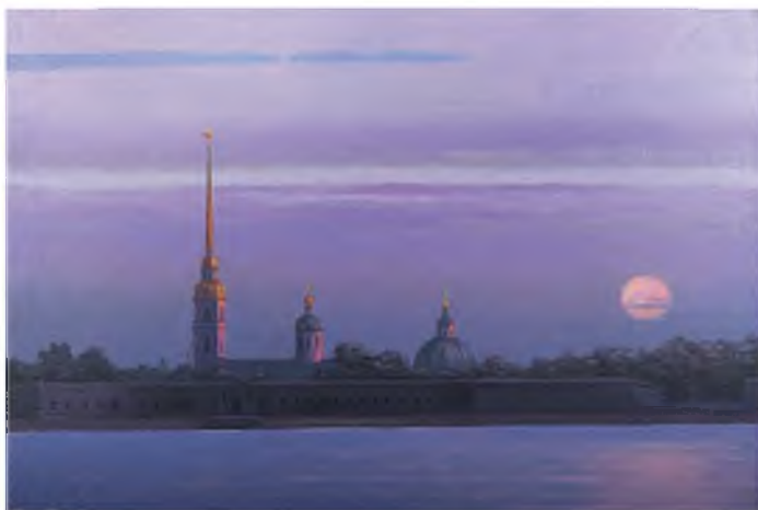
«Петропавловская крепость. Утро». 2014 г. Холст, масло, 60x90