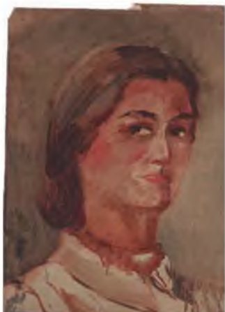
В.М. Белаковская Автопортрет. 1943 г. Картон, масло, 43х32 Из коллекции В.В. Прошкина, г. Санкт-Петербург