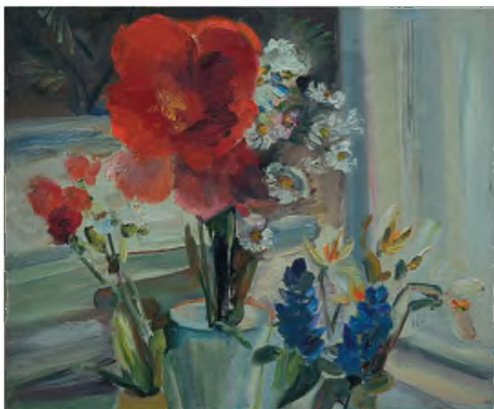
Натюрморт. 2000-е Холст, масло, 46х60 Из собрания художника, Санкт-Петербург