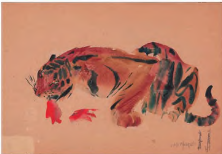
«Тигр». Бумага, акварель