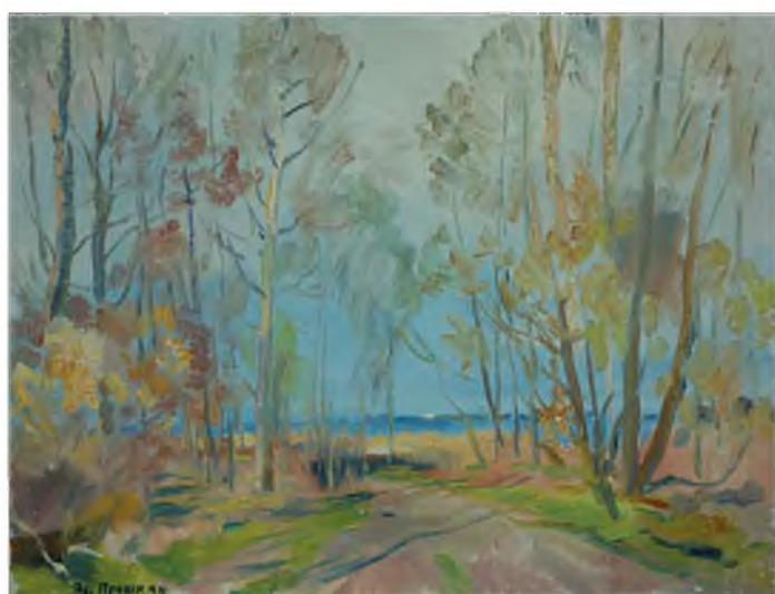
«Весенний пейзаж». 2000-е Холст, масло, 46х60 Из собрания художника, Санкт-Петербург