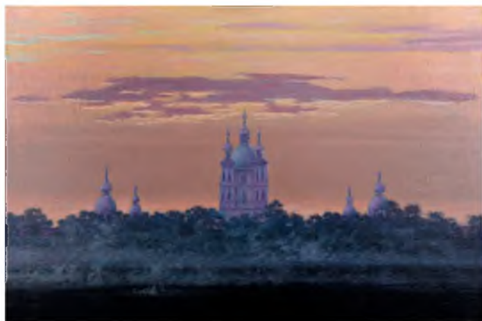
«Смольный собор». 2014 г. Холст, масло, 60x90

80-летию начала блокады Ленинграда посвящается