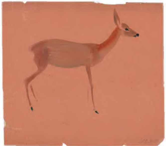
«Серна». Бумага, акварель

А.Г. Траугот. Из серии «Мои любимые животные». 1950-е Бумага, акварель Из собрания А.Г. Траугота, Санкт-Петербург