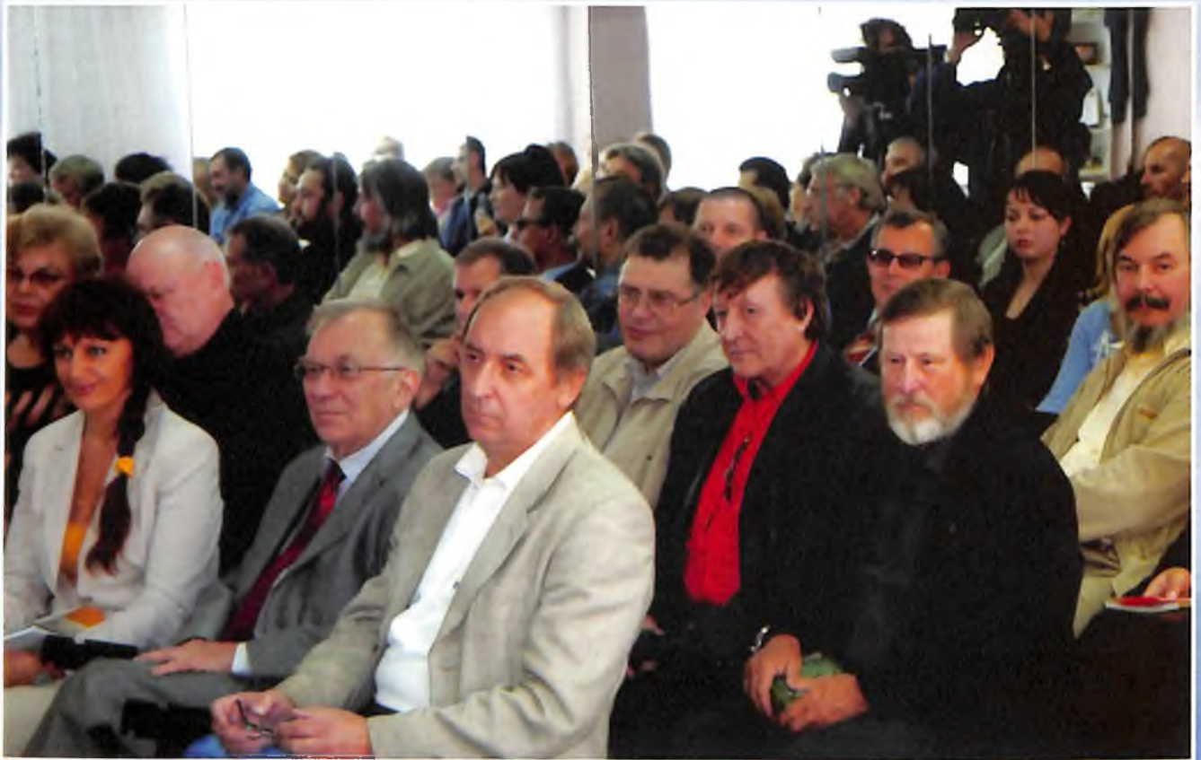
Литературный десант в Нижневартовске.