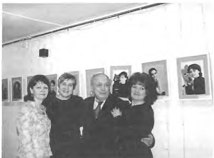
Давно не виделись!