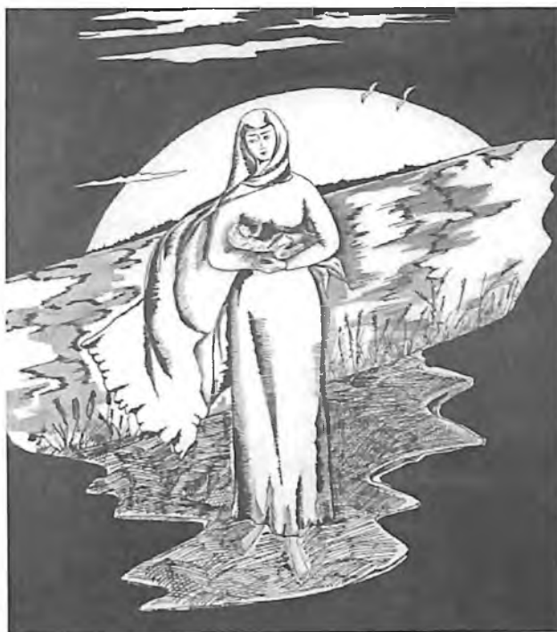
Рис. Ирины Холoméевой. Оформление книги стихов В. Худяковой

Избранная автором форма не нова: достаточно вспомнить В. Розанова, будетлянина В. Хлебникова, да и сам Пушкин часто писал на клочках бумаги, сидя на тахте, скре-