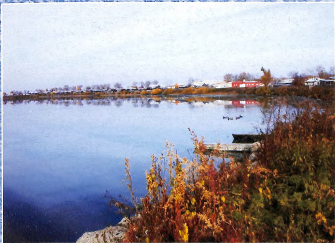
Юг тюменской земли. Бердюжский край. Лето.