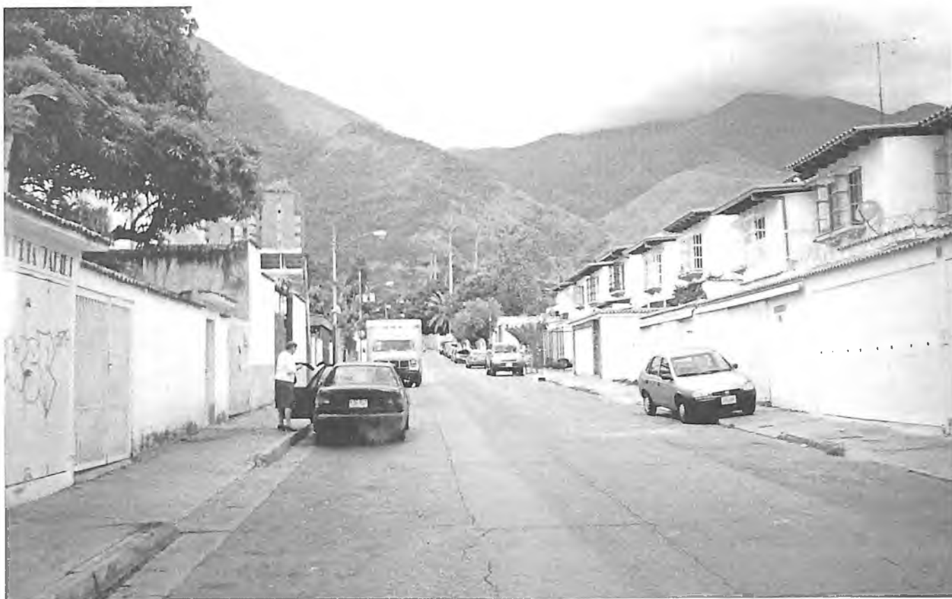
На улице старого Каракаса