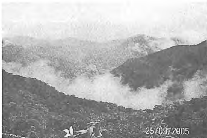
Венесуэла – горная страна