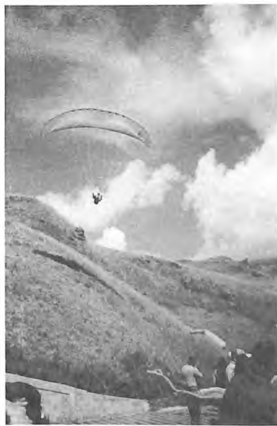
На горной дороге. Летательный аппарат