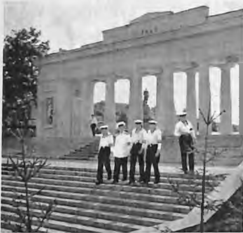
Севастополь. Графская пристань