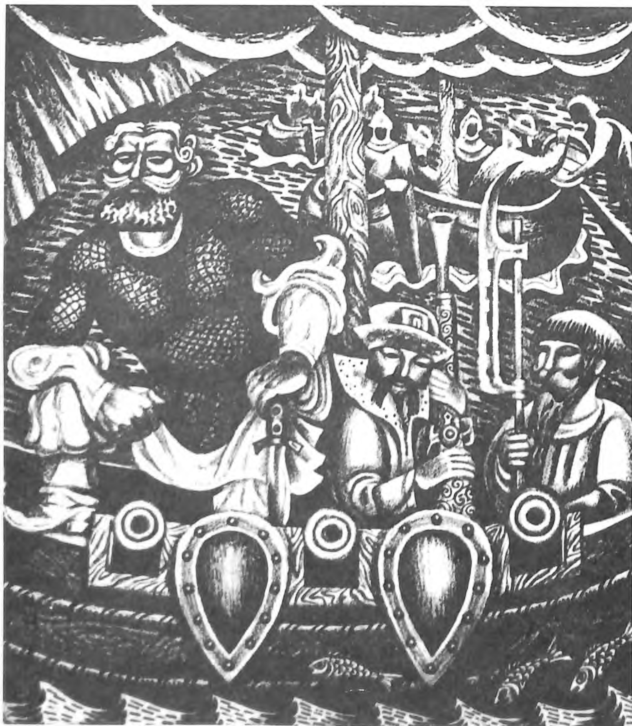
Генрих Засекин. Ермак. Литография.