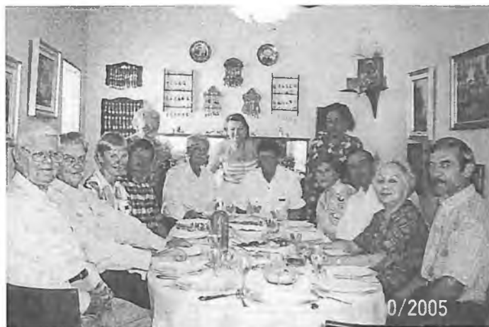
Русское застолье в Каракасе