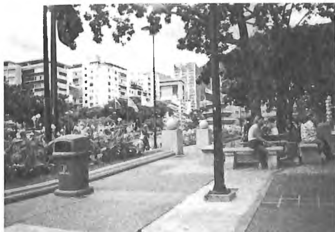
Площадь в центре Каракаса