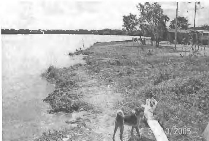
Залив-лагуна Карибского моря