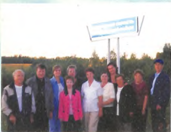
Земляки на границе района