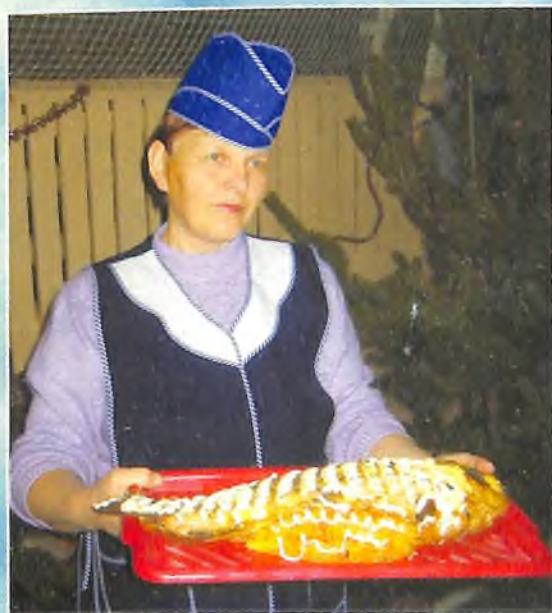
Приглашаю на ярмарку!