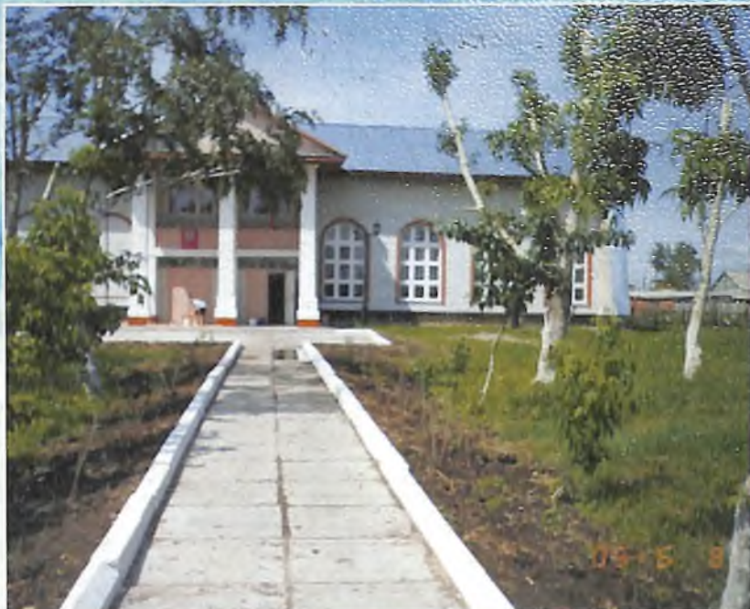
Дом культуры в с. Окунево