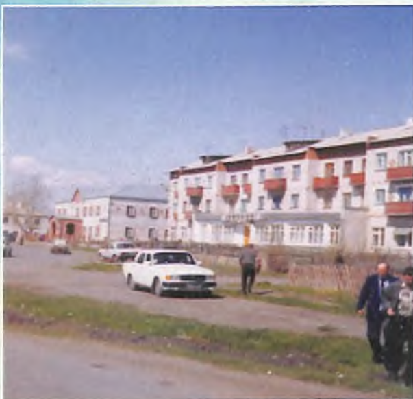
Улица в центре Бердюжья