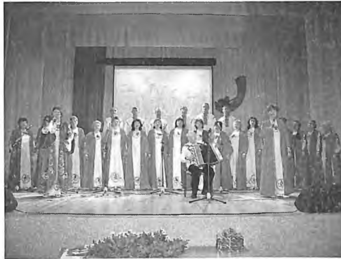
Русский народный хор

лябинском институте культуры. На мои приглашения ответили семь человек. Супружеская пара для руководства народным хором. Супружеская пара фольклористов. Работают они сейчас в Челябинском театре. Но нет жилья и зарплата небольшая. Едут к нам, поскольку наша администрация района обещает им квартиру да и зарплата их наша устраивает. Словом, год-два и наладится наша жизнь и работа, уверена «загнем» мы на высоком профессиональном уровне!