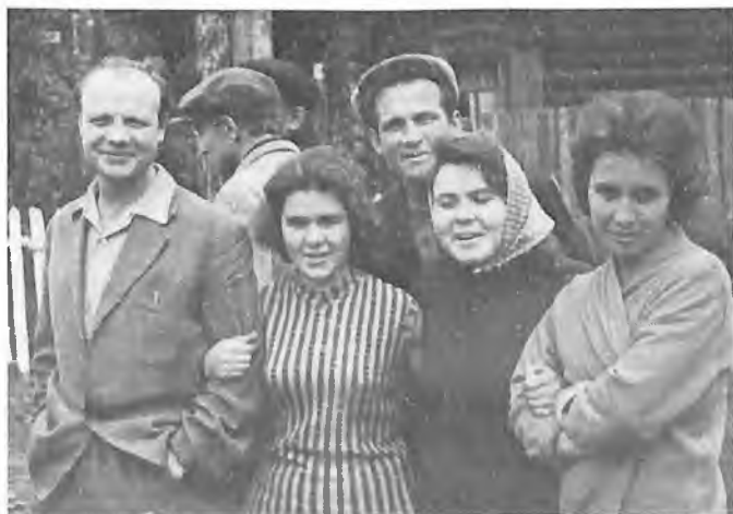
Я (слева) и мои друзья – актеры из Омутинского народного театра