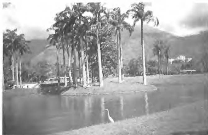
В восточном парке Каракаса