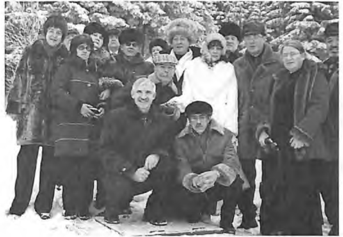
Писатели Сибири и Урала в гостеприимном Ханты-Мансийске

В наше время очень модно спонсоров искать повсюду. Вот иныя учрежденья