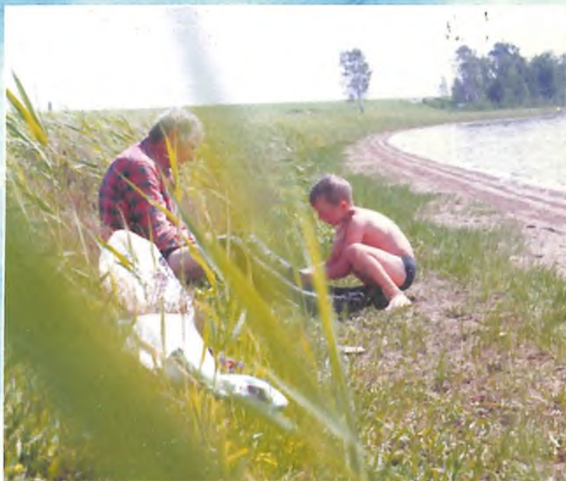
На озере Соленом