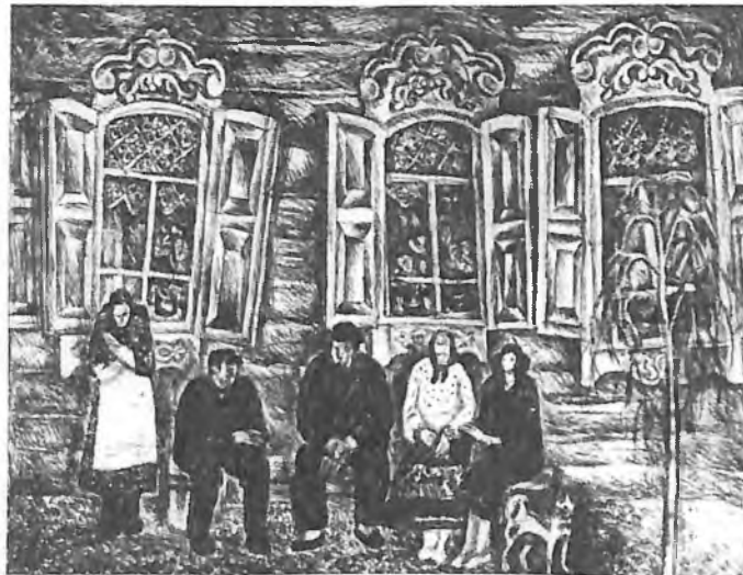
Старожилы. Художник Ю. Акишев

я «простого» крестьянского происхождения, а мне довелось подниматься на высокие ступеньки почета за успехи в советском и мировом спорте...»