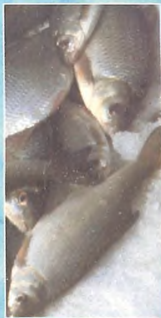
Живое серебро озер