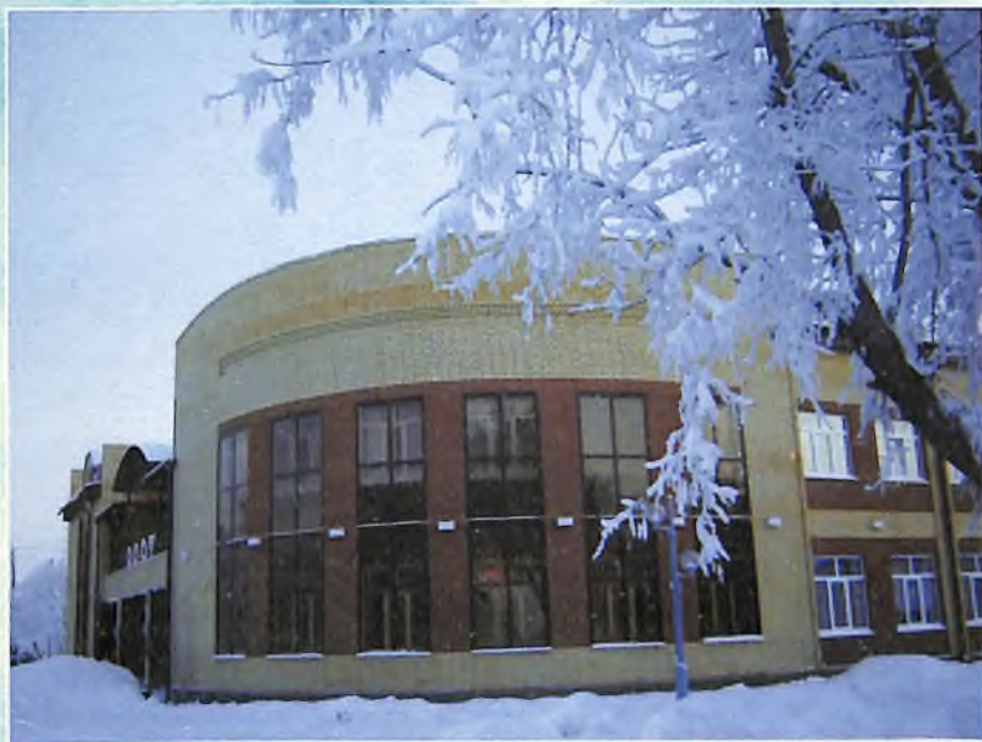
Новый Дом культуры в Бердюжье. Открыт 13 декабря 2006 года