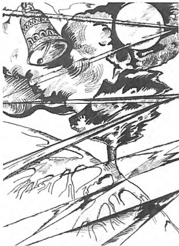
Рис. И. Холомьевой

Юрий Новоженев. «Социобиологический анализ прекрасного»