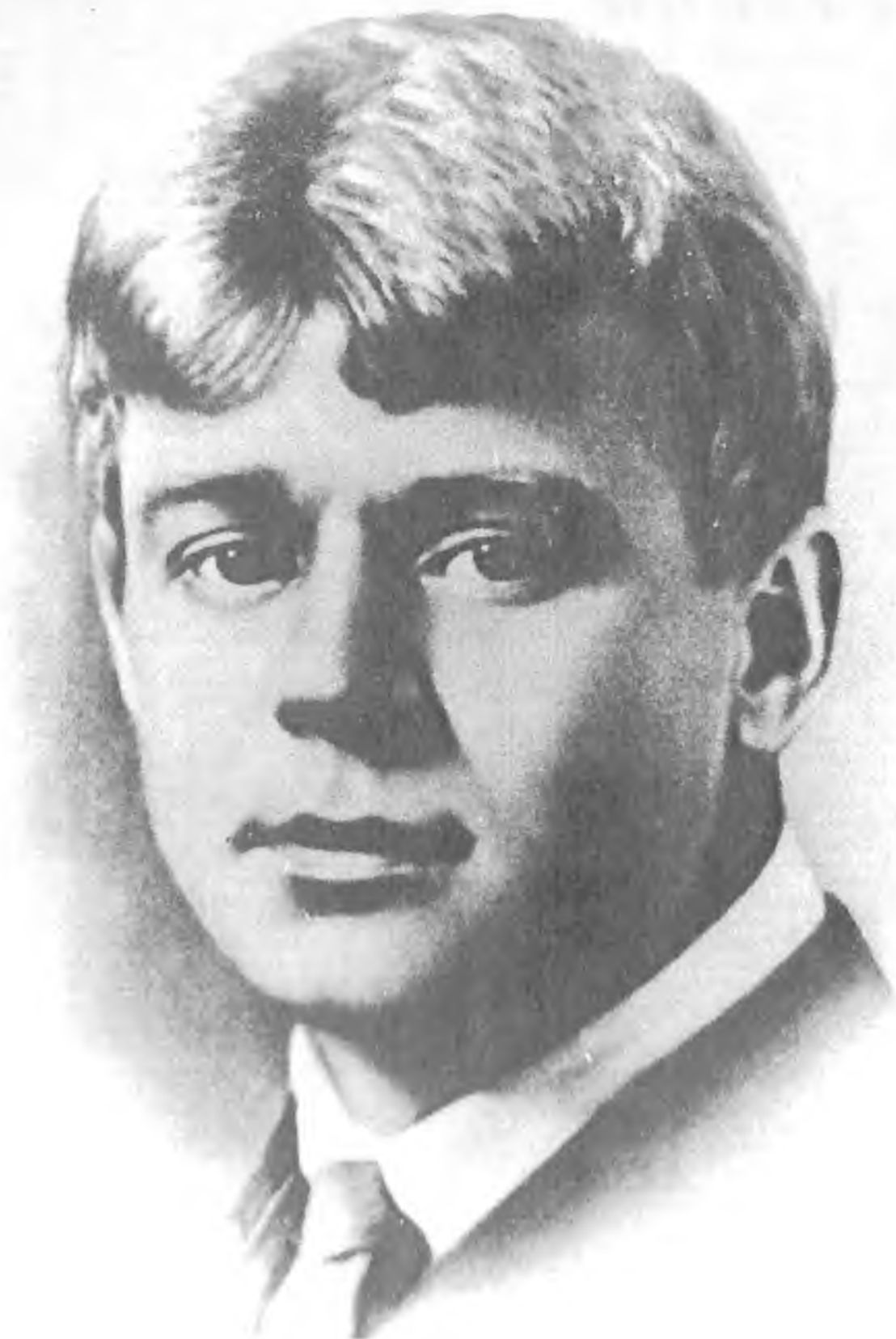
Сергей Есенин, 1925 г.