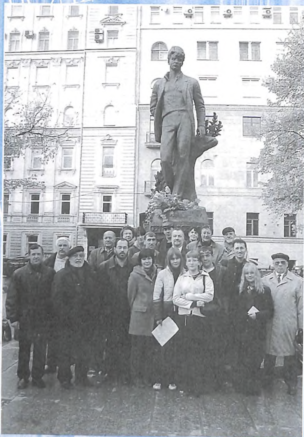
Русские поэты, студенты Литературного института — у Сергея Есенина. Москва. Тверской бульвар. 3 октября 2004 года.

Я буду воспевать Всем существом в поэте Шестую часть земли С названьем кратким «Русь». С. Есенин.