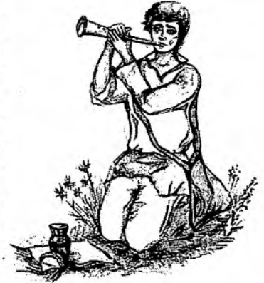
Рисунок Ирины Холомьевой