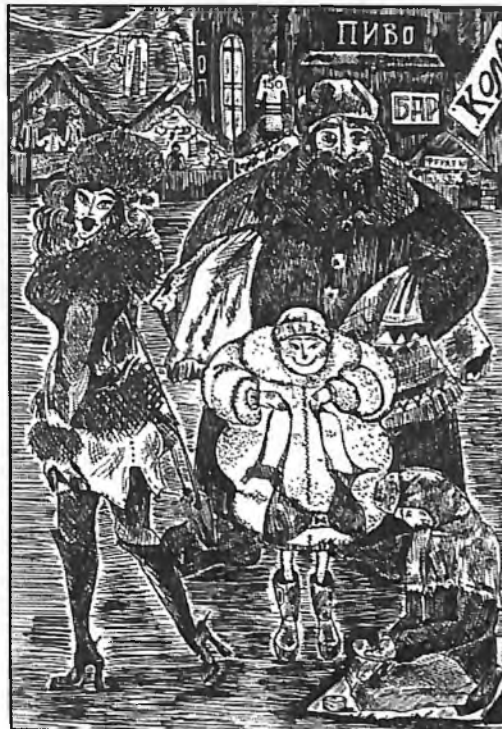
Рисунок Ирины Холомьевой