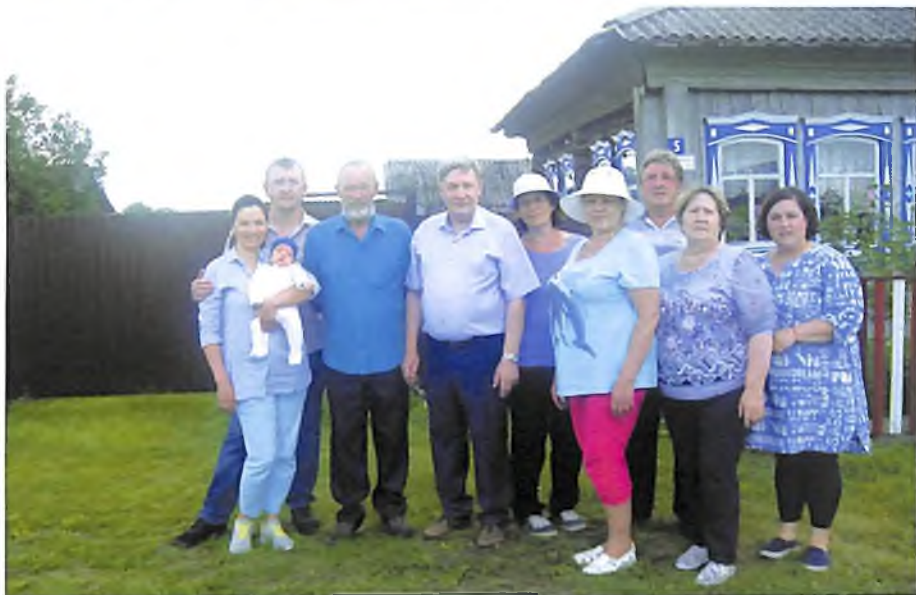
Деревня Губина Упоровского района. С братом и сёстрами у родного дома