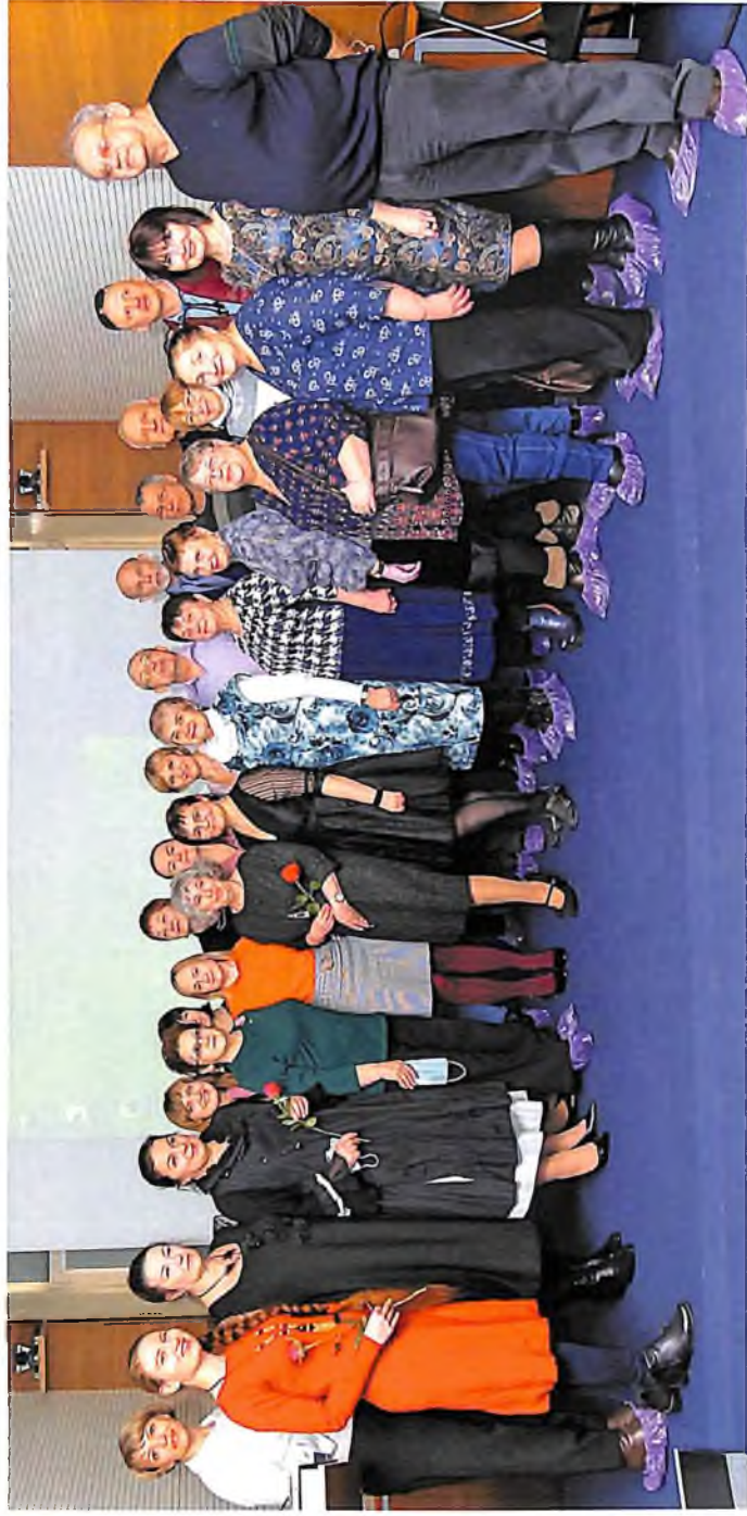
19.03.21. Тюмень. ТОНБ им. Д. Менделеева. Свободный микрофон, посвящённый Дню Поэзии и презентация ЛПА «Гиперборей»