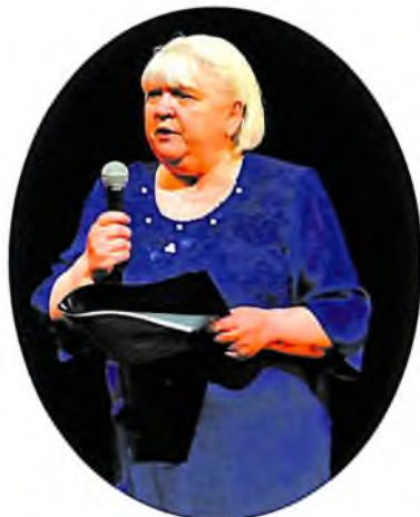
Фестиваль «ВСЕМИРНЫЙ ДЕНЬ ПОЭЗИИ», Тюмень, ВДП, 2021.