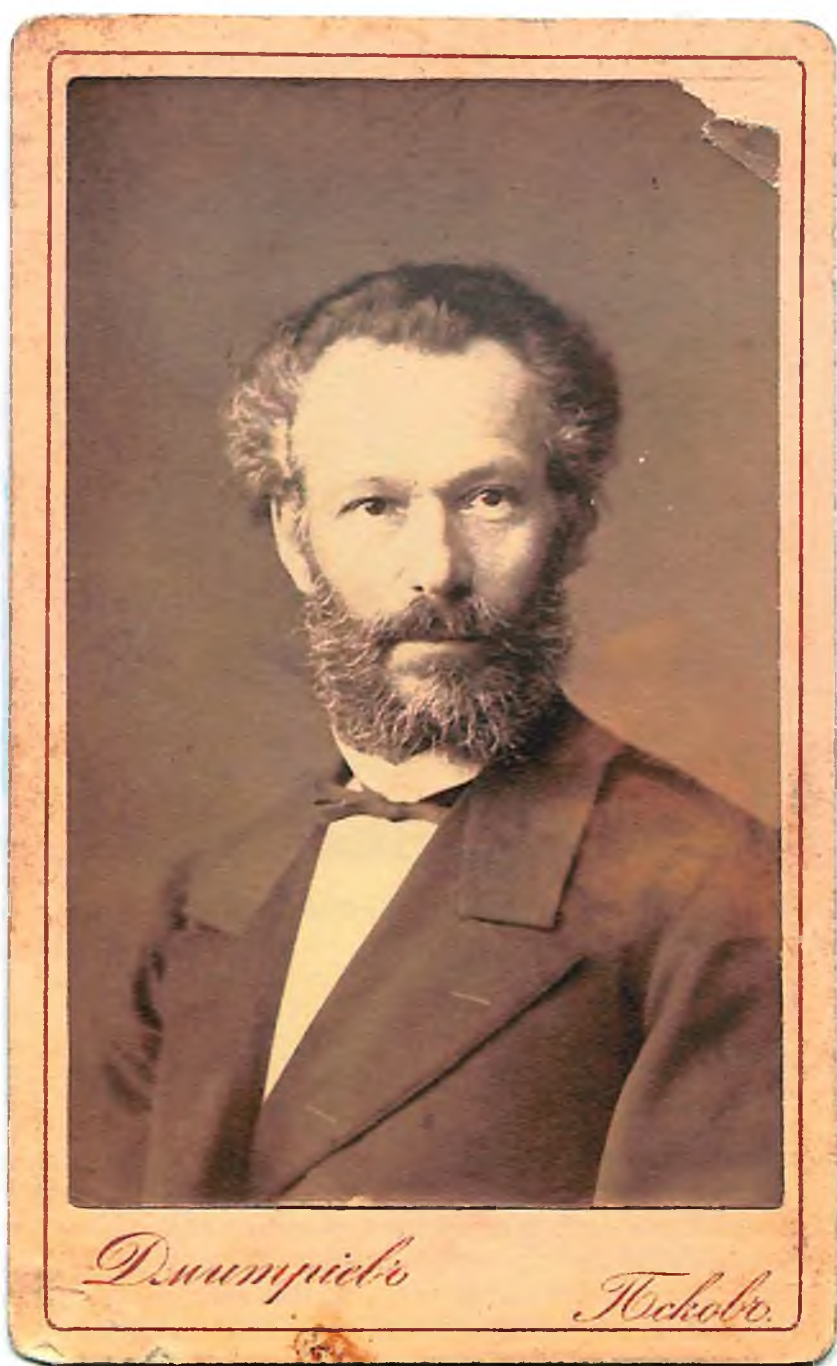
Художник Николай Иванович Соколов