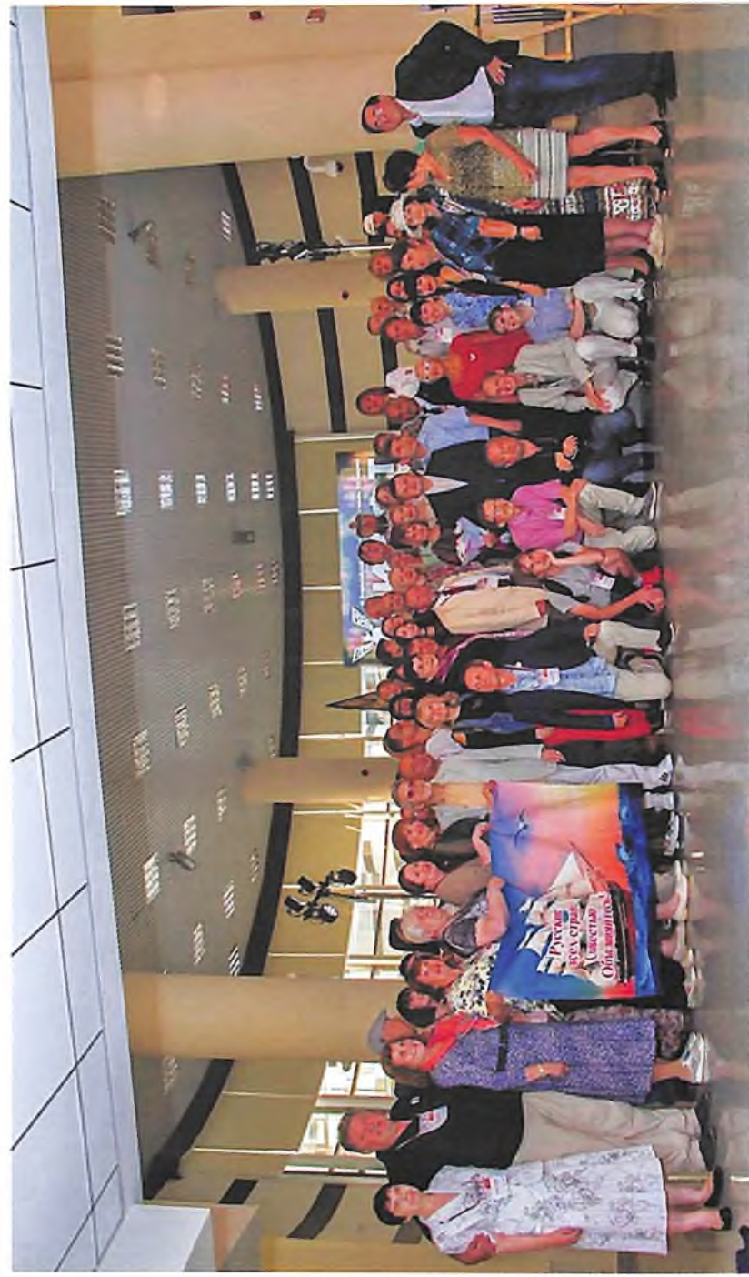
26.07.2019 по 29.07.2019. РФ, Тюменская область, г. Тюмень. IV Всероссийский Литературный фестиваль фестивалей ЛифФт-2019