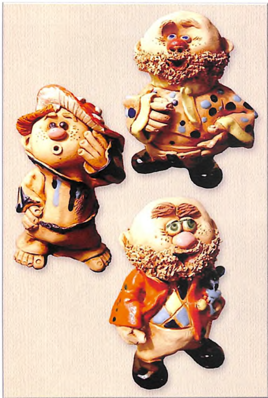
Керамика. ДОМОВЯТА. Работа Елены САВЕНОК. г. Омск