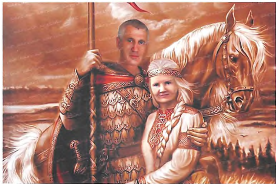
Иллюстрация к онлайн-концерту «ДЕНЬ РОССИИ»