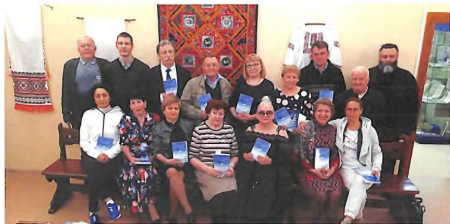
04.06.2021. Сургут. Дом журналистов. Презентация общего сборника ЛитО «Северный огонёк» «Чудеса, что жизнь нам подарила» и нашего 36-го номера альманаха.