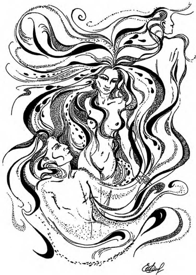
Графика. «Восхищение» Работа Елены Савенок г. Омск