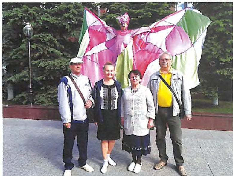
27.05.2021 г. Тюмень. ТОНБ им. Д.И. Менделеева. Всероссийский День библиотек. Флешмоб «Обними библиотеку».