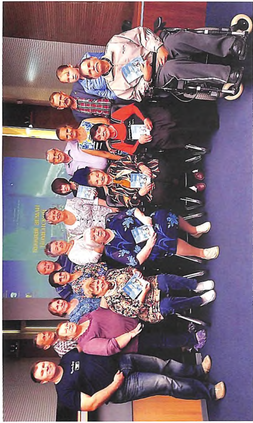
4.06.21 г. Тюмень. ТОНБ им. Д.И. Менделеева. Презентация 36-го номера литературно-краеведческого альманаха «Поэзия земли Тюменской».