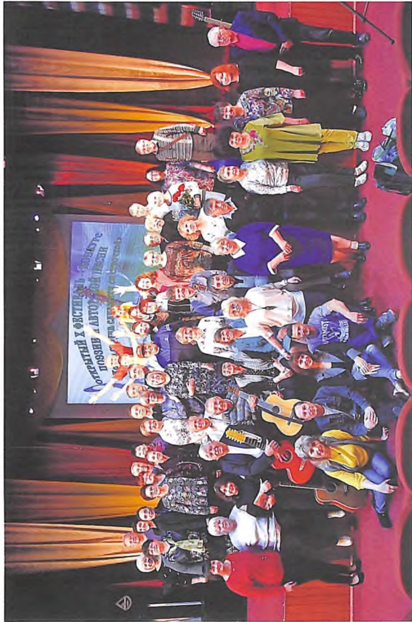
07.09.2019 г. Нижняя Тава. Фестиваль «Когда струна сливается со строчкой».