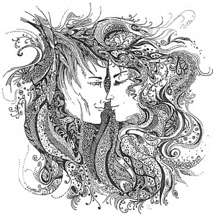
Графика «Пара» Работы Елены Савенок г. Омск