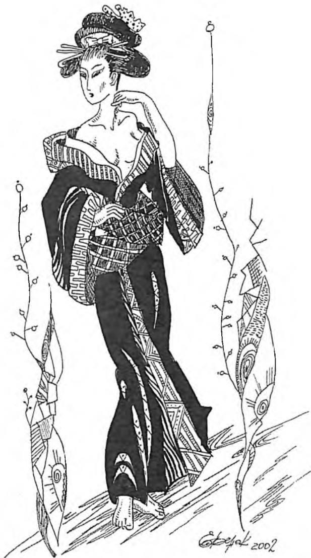
Графика «Японка» Работа Елены Савенок г. Омск