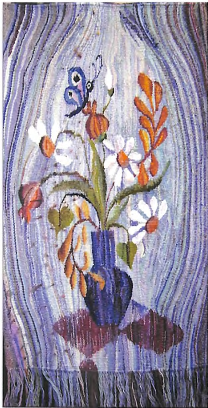
Гобелен «Натюрморт». Работа Елены Савенок. г. Омск