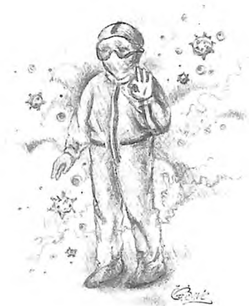
Рисунок Елены САВЕНОК, г. Омск

Свидетельство о публикации №220100701840