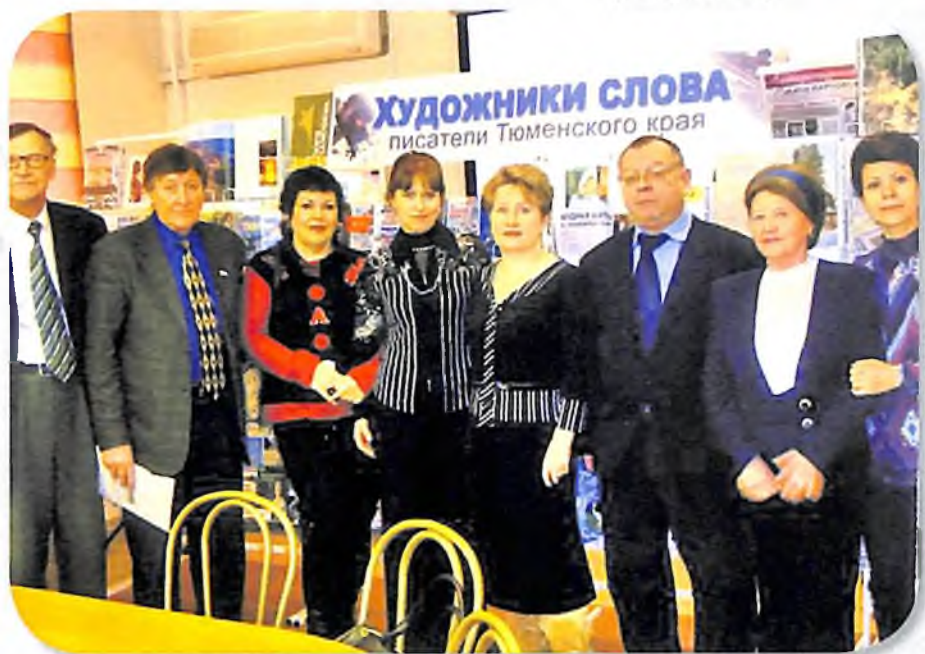
Февраль 2009 г. Тюмень, ул. Осипенко 19, оф.3, Союз писателей России (Тюменское отделение). На фото: писатели Нижневартовска и писатели Тюмени.