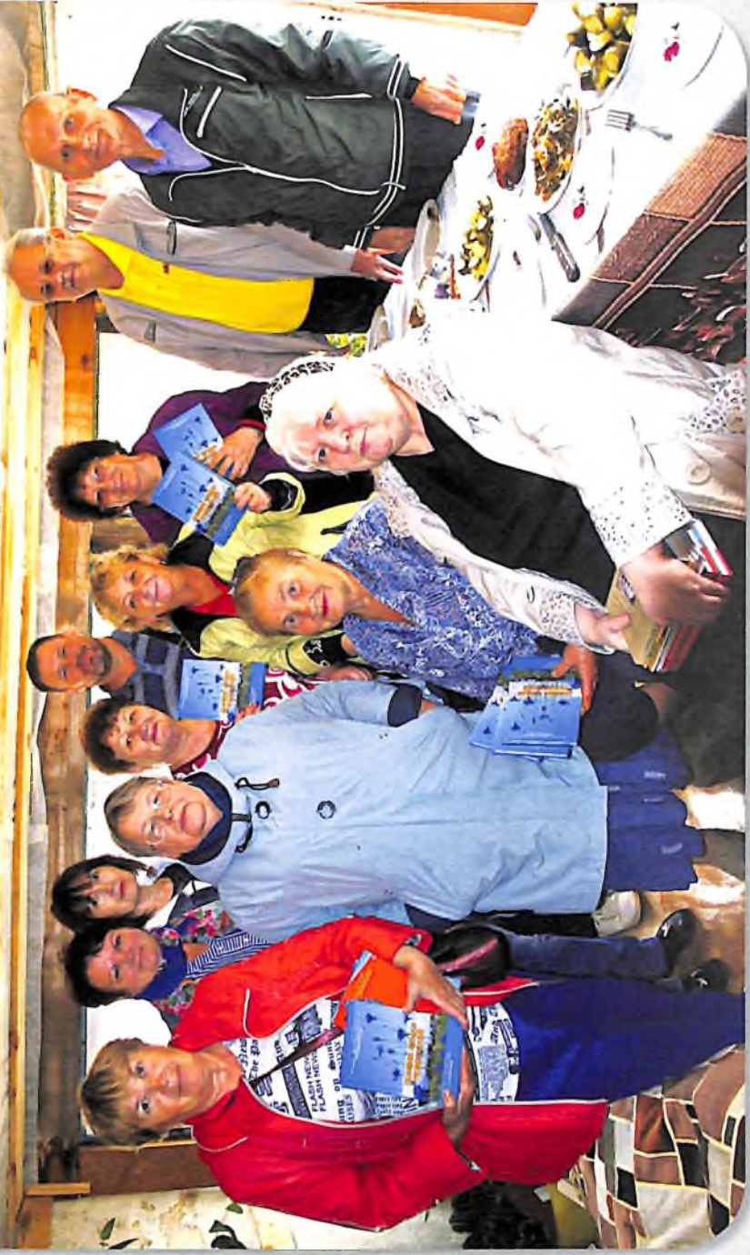
23.08.2020 г. Тюмень. В ГОСТЯХ У НАДЕЖДЫ Презентация 33-го номера нашего альманаха состоялась!