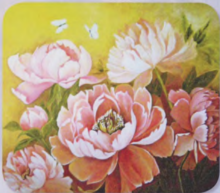
Пионы - холст 60х60, масло, 2017, YRIA