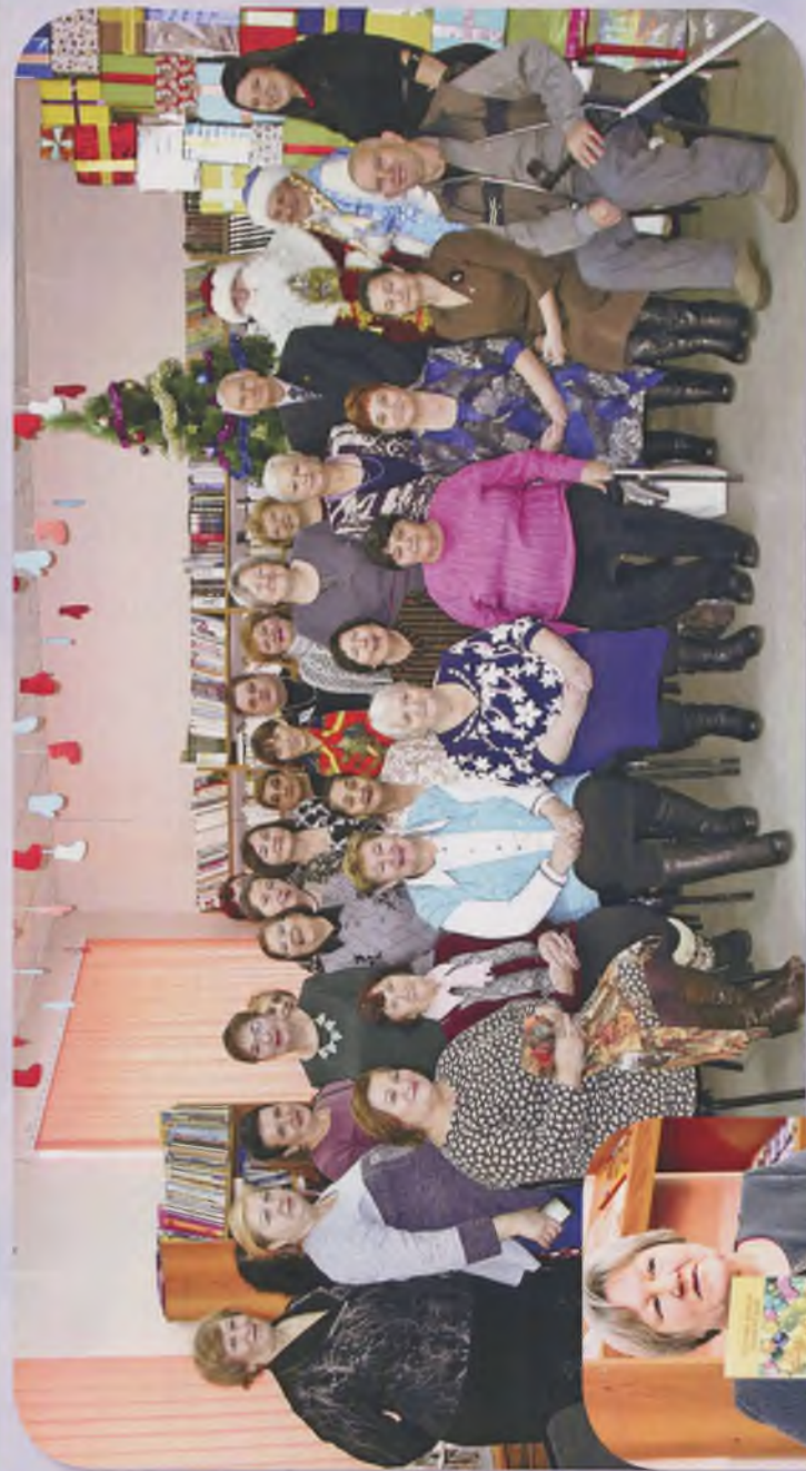
17.12.2019 г. Село Бердюжье. МАУ библиотека Бердюжского района «Престиж». ЛитО «Родники земли моей» исполнился один год.