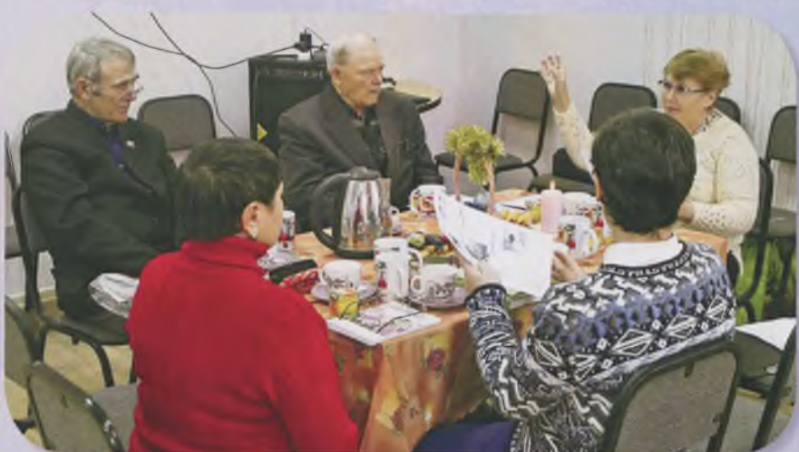
21.12. 2019 г. Село Армизонское. Армизонская ЦБС. Дружная команда творческих людей Армизонского района.