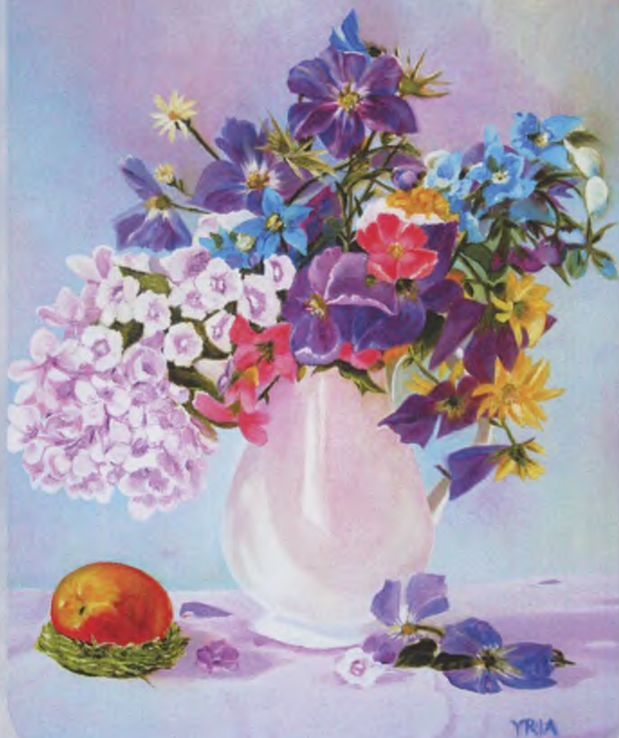
Летний букет - холст 35х25, масло, 2015, YRIA