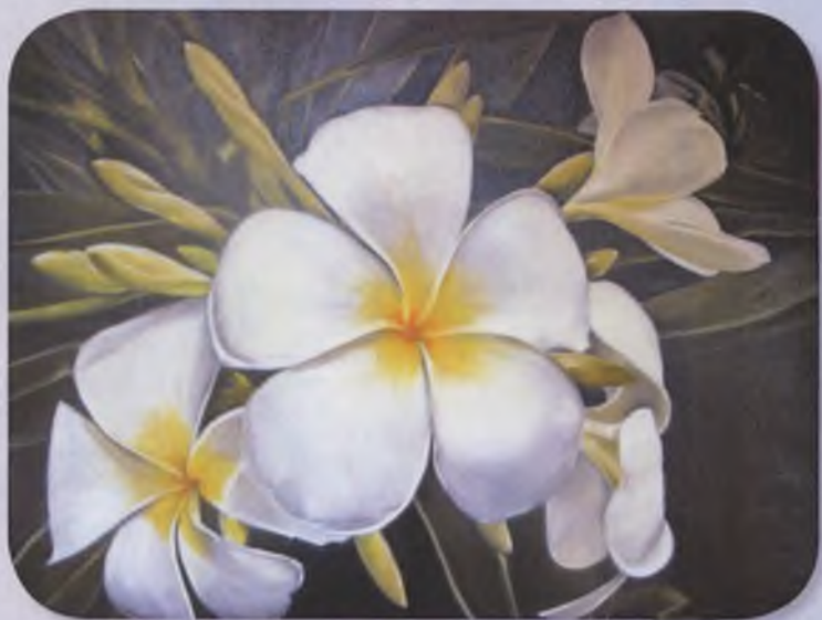
Франжипани - холст 45х65, масло, 2018, YRIA