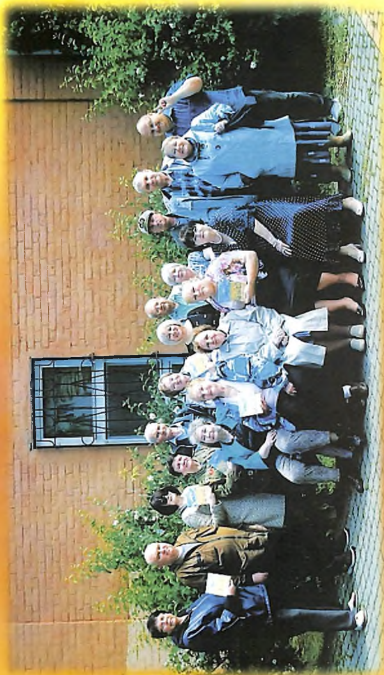
06.07.2019. г. Тюмень, ТОО «Общество Русской Культуры». Презентация нашего очередного 29-го номера альманаха.