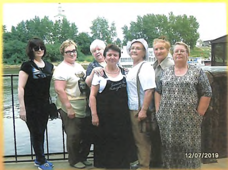
12.07.2019. На теплоходе музыка играла....