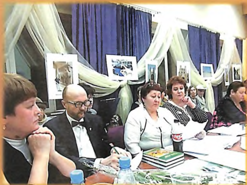
07.11.2016 г. пос. Приобье, Октябрьский р он, ХМАО Югра. Презентация «Живой книги Самотлора».