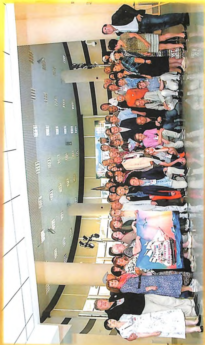
IV Всероссийский литературный фестиваль фестивалей — «Лифт» — проводится в Тюмени с 26 по 29 июля 2019 года. Со всей страны и из-за рубежа приехали более 200 прозаиков, поэтов, драматургов и литературных критиков...