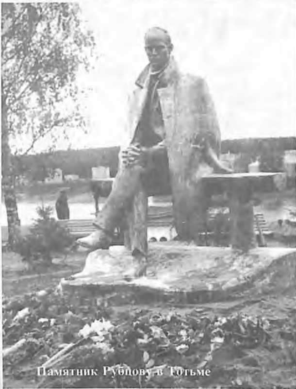
Памятник Рубцову в Гюльме

Выписывайте “Наш современник” — призывает и “Тюмень литературная”.