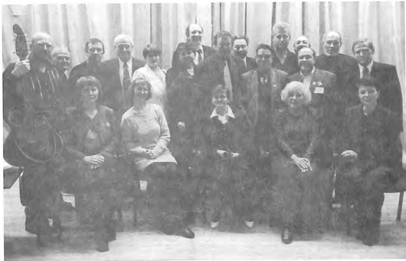
Участники праздника поэзии «Дни Рубцова» В Сургутском педагогическом институте.