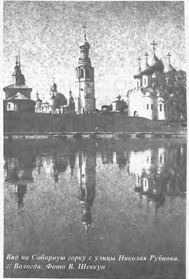
Вид на Соборную горку с улицы Николая Рубцова, г. Вологда.

Еще более необузданной фантазией, доходящей порой до абсурда, обладают авторы, когда у них речь заходит о