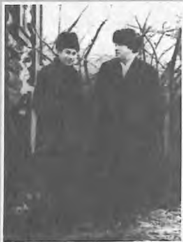
Н. Рубцов и А. Шилов (редкий снимок)