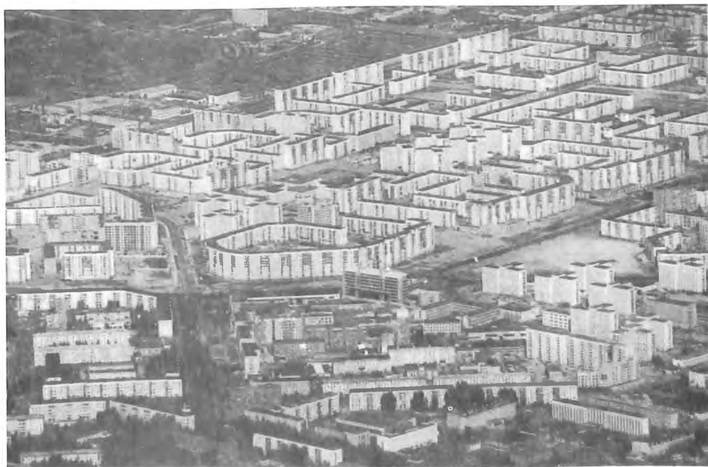
Панорама современного Сургута