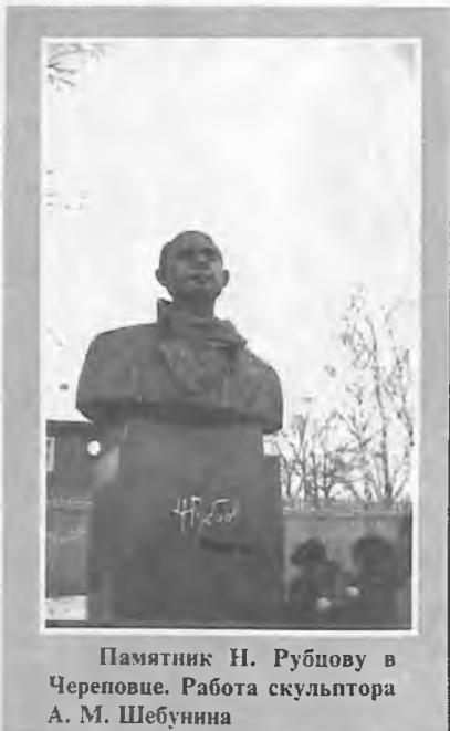
Памятник Н. Рубцову в Череповце. Работа скульптора А. М. Шербунина