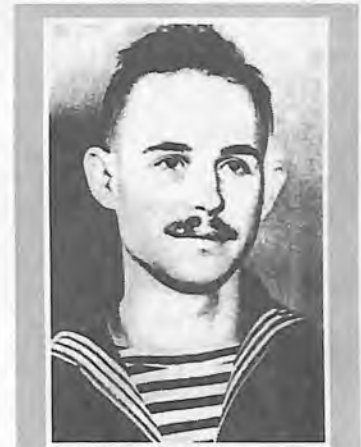
Н. Рубцов на Северном флоте