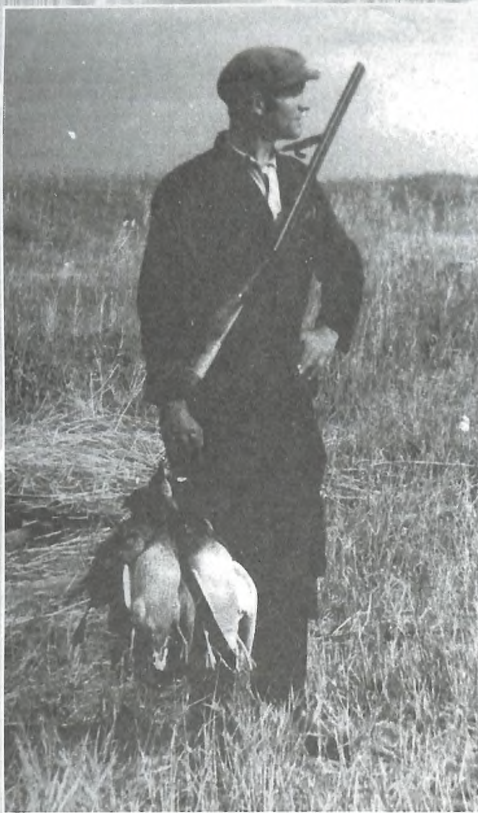
После утренней зорьки.