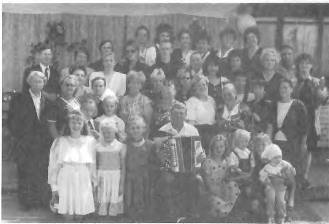
Коллектив Бердюжского РДК и участники художественной самодеятельности села Пеганово.