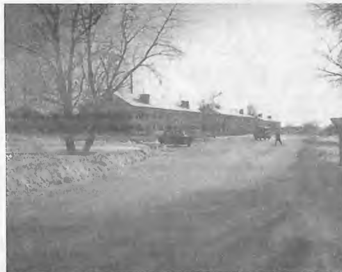
В центре села