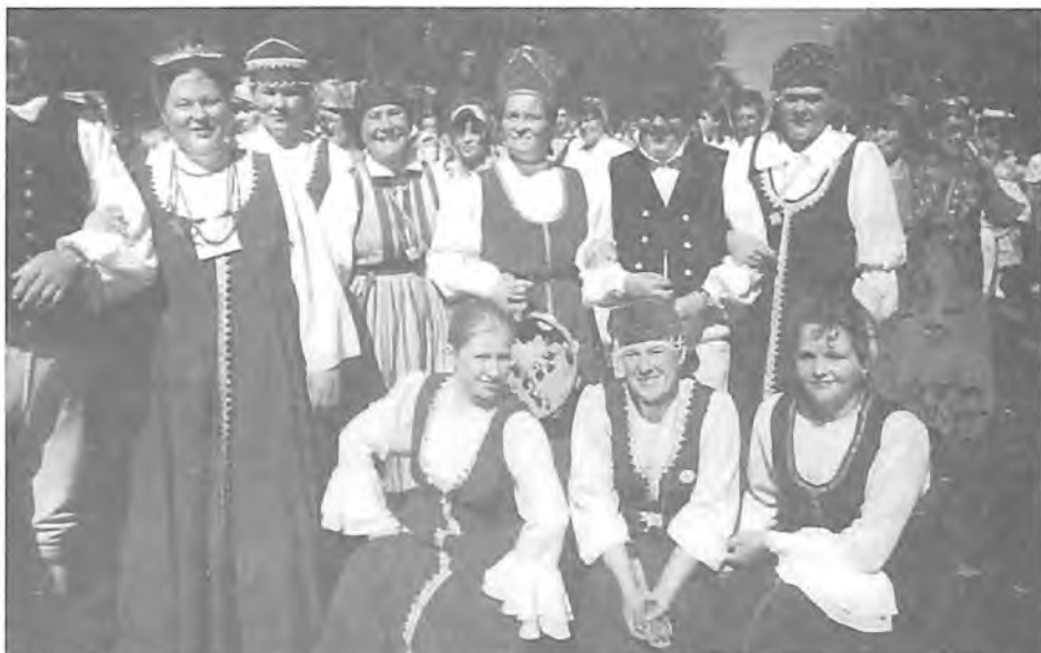
Фольклорный ансамбль "Озериночка" с гостями из Швеции.