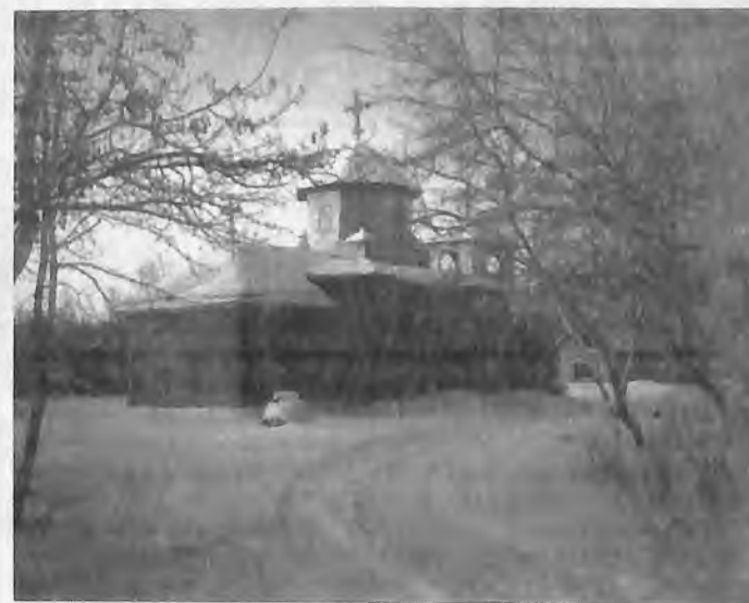
Новая церковь Рождества Пресвятой Богородицы