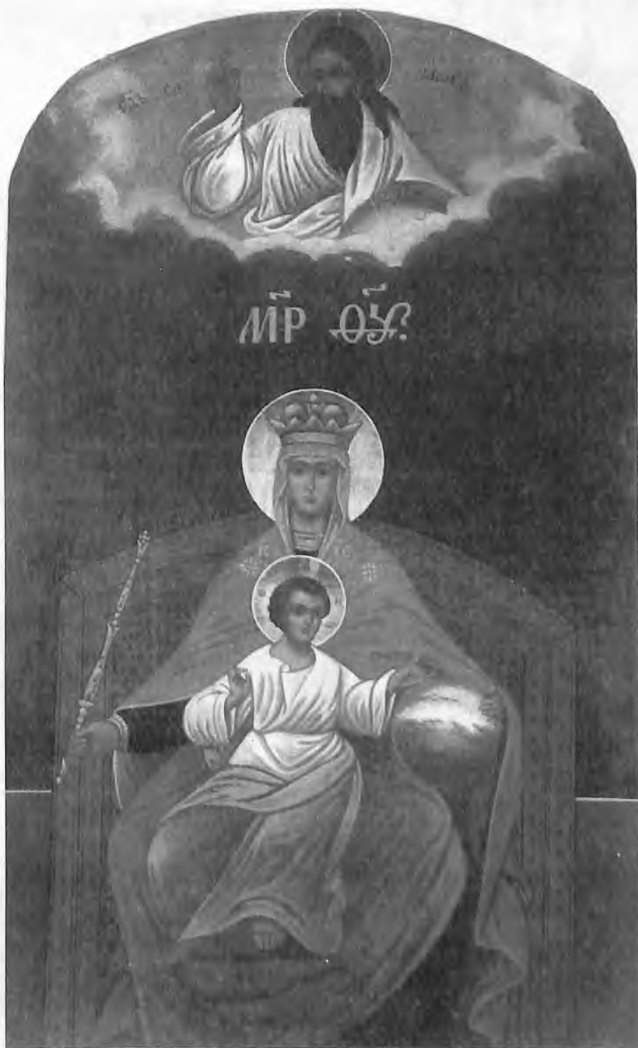
Державная икона Божией Матери Из храма Святителя Николая в Хамовниках в Москве

Господь вверил нам, русским, великий спасительный талант Православной веры... Восстань же, русский Человек! Перестань безумствовать! Довольно! Довольно пить горькую, полную яда чашу — и вам и России.