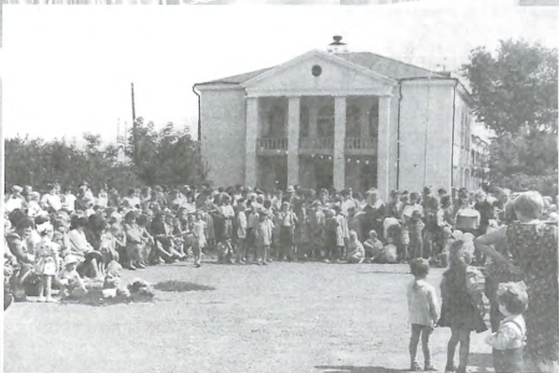
С. Бердюжье. Центральная площадь в праздник.

Творческий портрет Бердюжского района Тюменской области