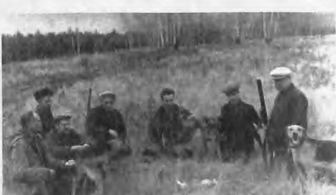
Охотники на привале