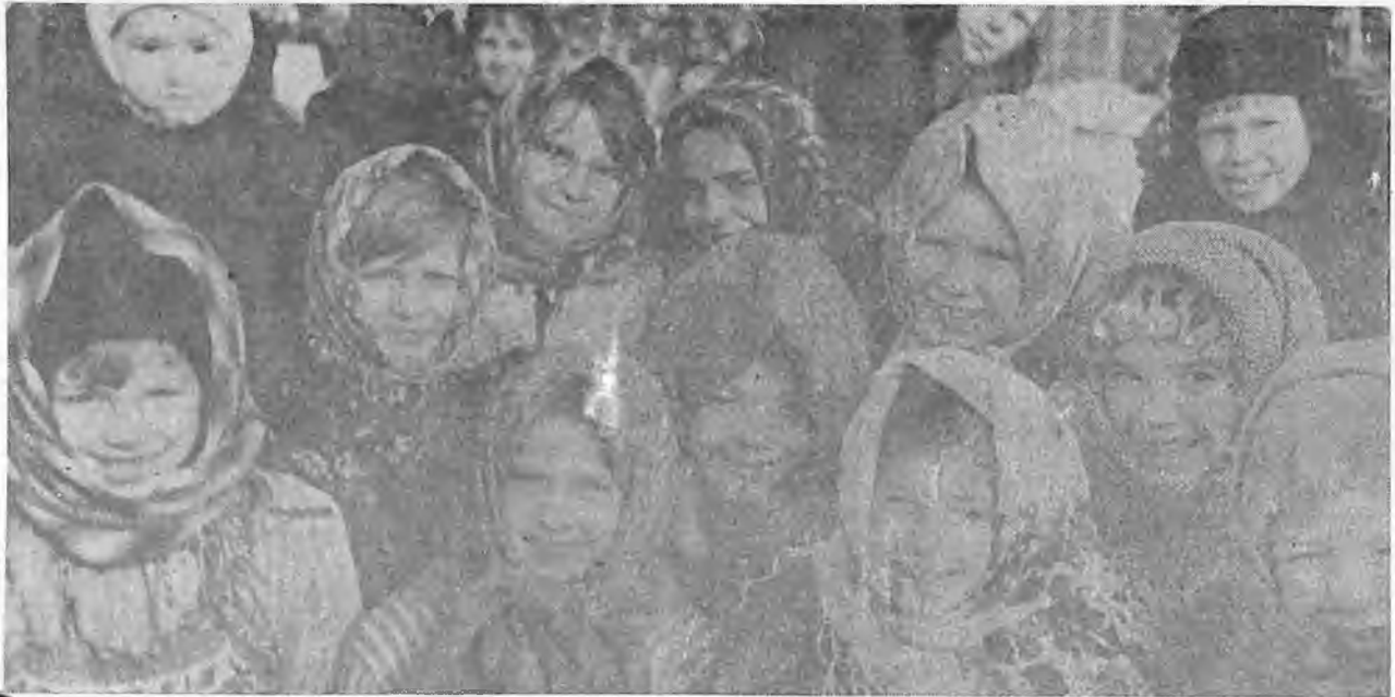
У нас в деревне весело!