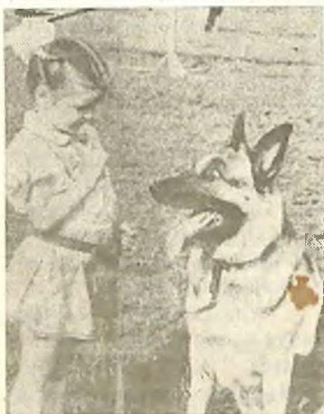
СЛУШАЙСЯ СТАРШИХ!

Звезды падают с небес, Как с обрыва камни. Чтоб не влез к вам Ночью бес, Запирайте ставни. г. ТЮМЕНЬ.