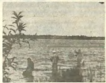
«ОХОТА ПУЩЕ НЕВОЛИ».