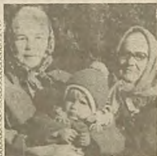
Маленькую внучку Бабушки любили. Угощали сладким, На руках носили.