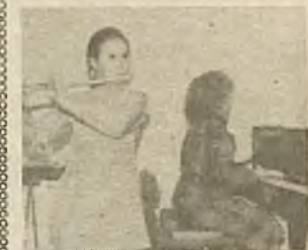
Дочь на дудочке играет. Маму с папой развлекает. А когда придет пора, Заведется детвора, — Дочь о ней будет радеть, Для нее станет дудеть.