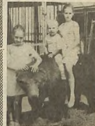
Дети бегали в зверинец. Посядеть на мишке. Был он чуточком, игрушкой. Не страшна даже Гривас.