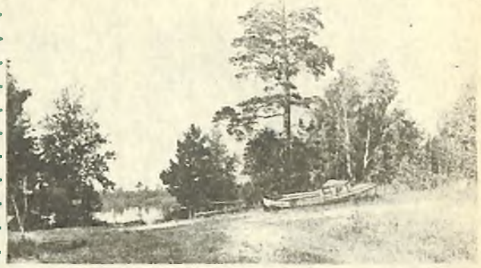
У озера Богуши.