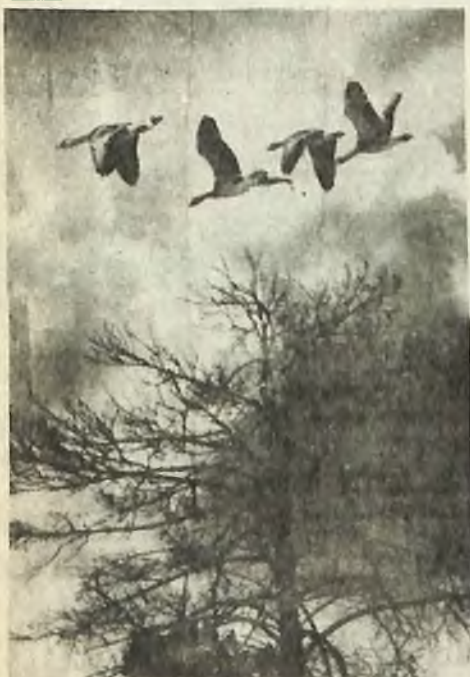
«Гуси летят вереницей: птица за ближней птицей». Вера Блик.