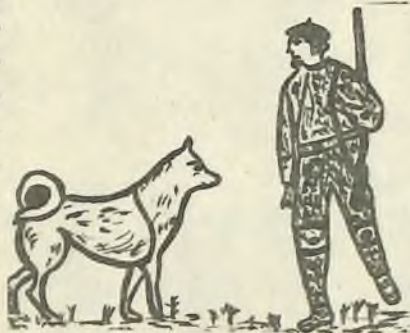
«Сподвижницей моей была в лесу Беглянка».

Туман, будто палом*, заводок оз- ро. Плыть к сетям не было смысла. В таких густуших, белесых клубках проскочишь тычку** и заплутаешь, как в потемках. Надежнее с часок подождать.