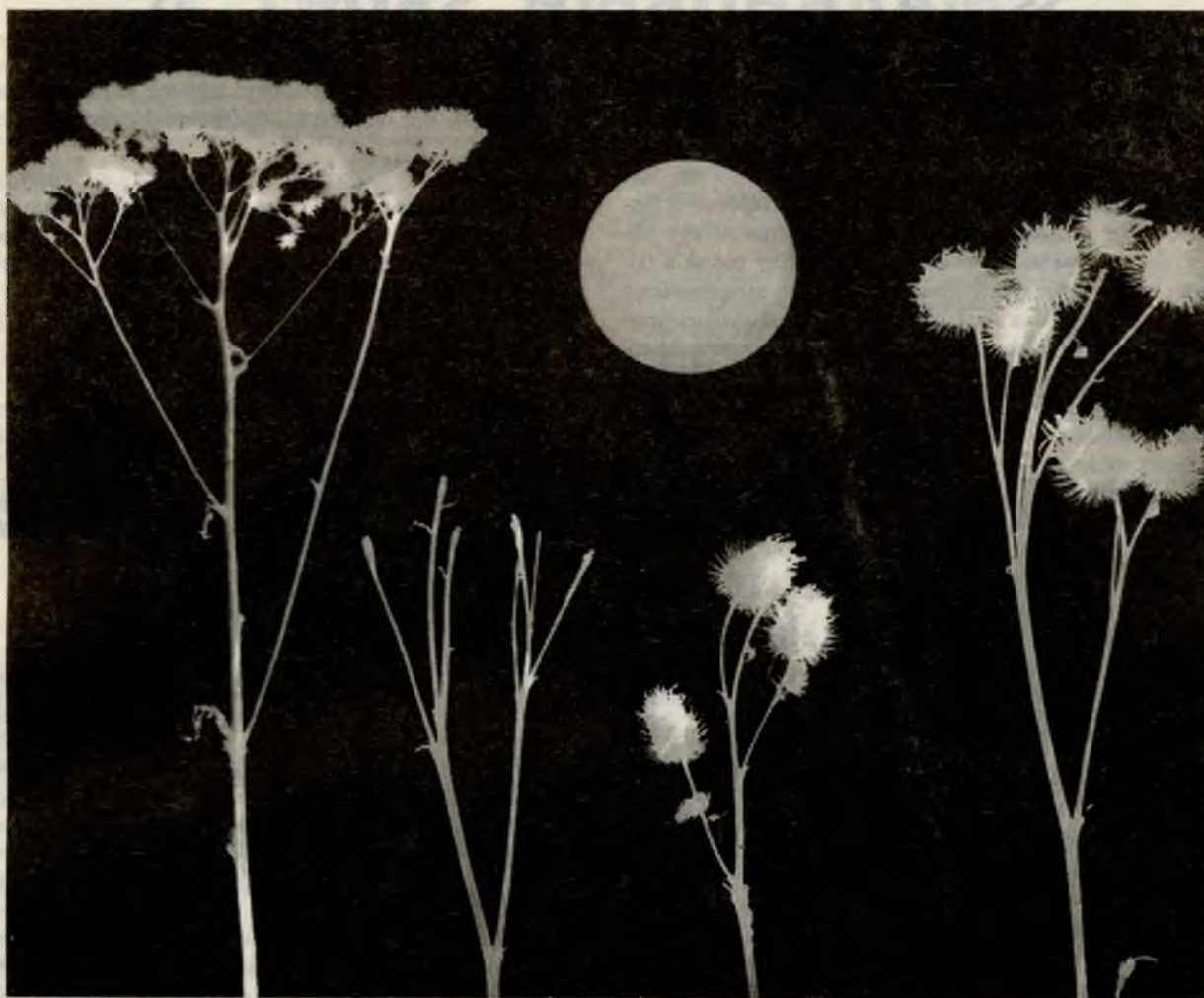
Коллаж В. Тюрина

Когда вдали угаснет свет дневной И в черной мгле, склоняющейся к хатам, Все небо заиграет надо мной, Как колоссальный движущийся атом, —