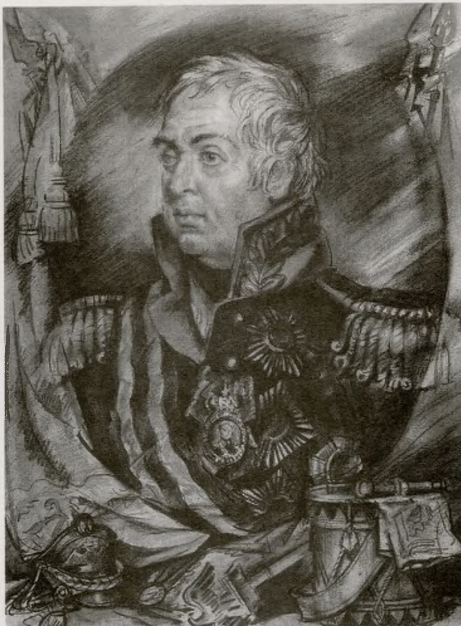
Михаил Илларионович Кутузов 1745–1813