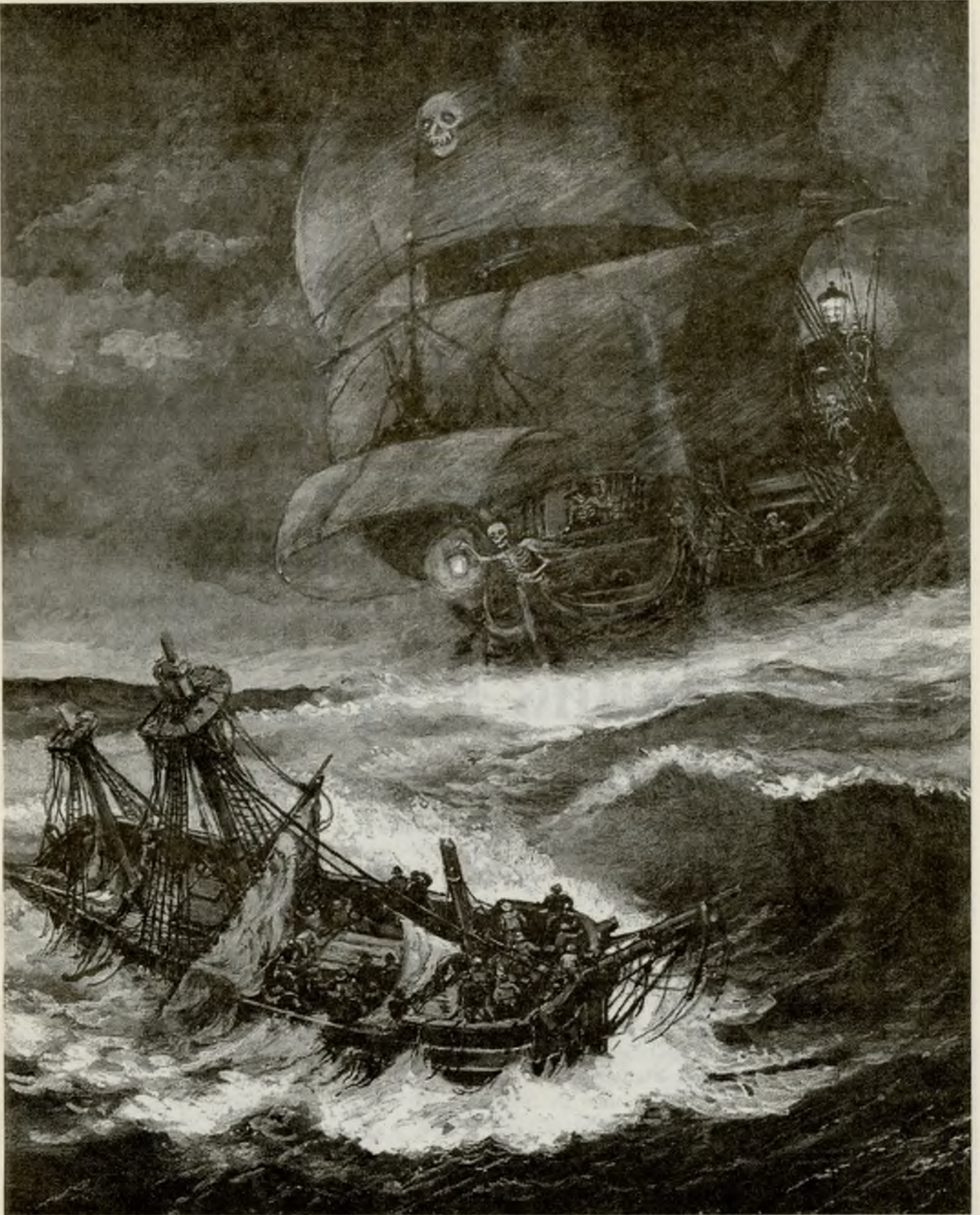
Рисунок Е. Войшвилло.

«Летучий голландец» – зловещий корабль-призрак.