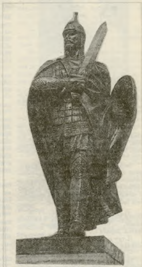
Дмитрий Донской. Скульптура В. Клыкова.