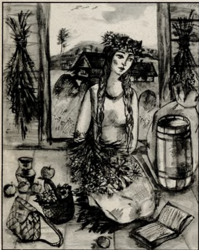
Рис. И. Холомьевой. Из иллюстраций к сборнику стихов Веры Худяковой "От лета — до весны".

Первый номер вышел в июле 1972 г. Издание возобновлено в декабре 1989 г.