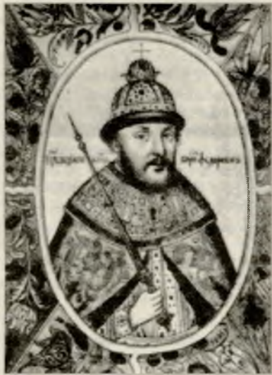
Царь Борис Федорович Годунов. Из Титулярника

бытия был принужден искать и найти выход из-под полицейской опеки, калечащей его душу и унижающей достоинство человека в нем. Пушкин, определившись с темой будущей трагедии, прекрасно осознал, на что идет, сочиняя «Бориса Годунова», собрав перед собою персонажей трагедии — Шуйского, Воротынского, своего предка боярина Пушкина, Басманова, царя Бориса и прочих в русском стане, а наряду с ними польских ясно-вельможных панов и, наконец, царевича Димитрия, до сих пор называемого