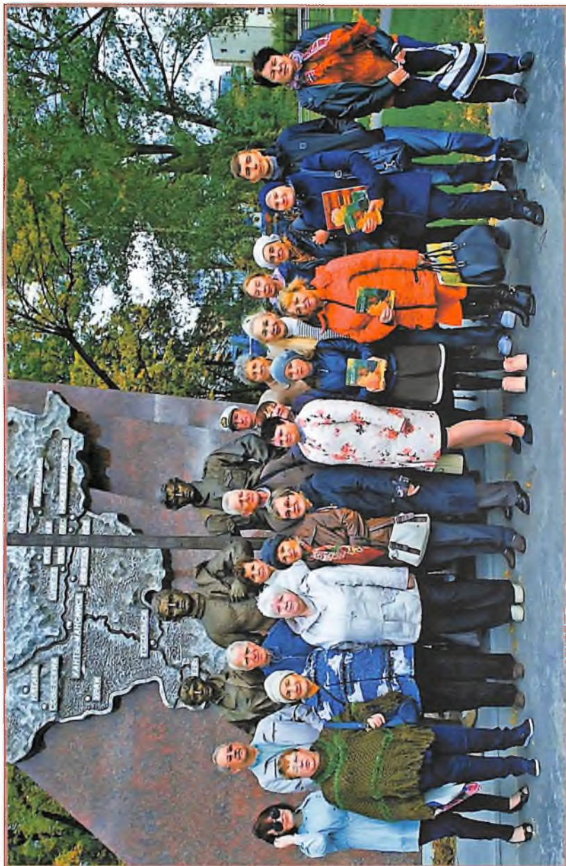
15.09.2018. Тюмень. Сквер им. Семёна Пацко. У монумента «Молодым созидателям земли Тюменской» (открыт 18.08.2018). Экскурсия по скверу перед презентацией альманаха №26.