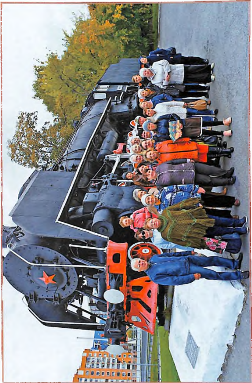
На краю сквера им. Пацко в память о самоотверженном труде железнодорожников во имя Великой Победы в 1987 году установили паровоз ФД 21-3031.