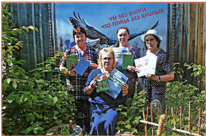
13.07.2018, сп Большие Леуши, Октябрьский район, Библиотека. Совет ветеранов и работники культуры посёлка ознакомились с творчеством авторов нашего альманаха.