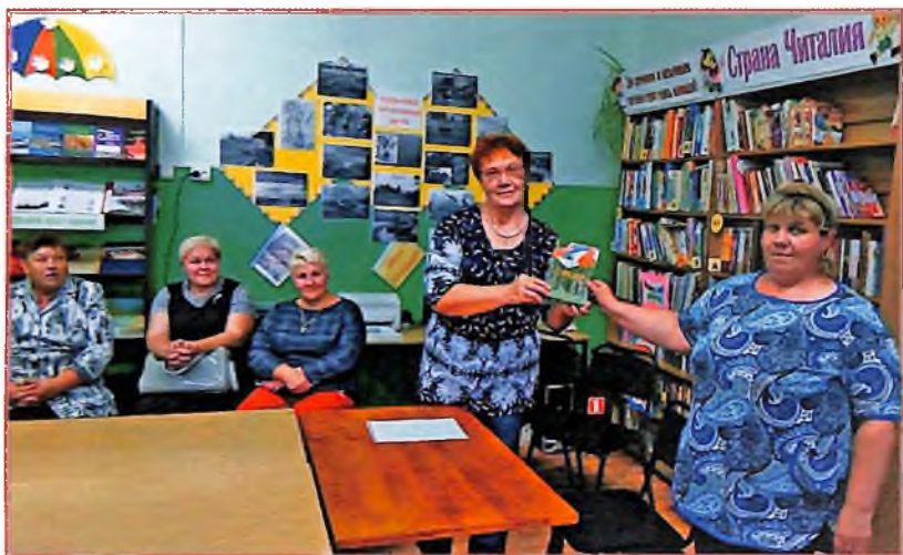
22.08.2018. Литературные чтения «Читаем вместе» в рамках проекта «Диалог поколений». На память о встрече с юными читателями – книга в подарок Гилёвской библиотеке.