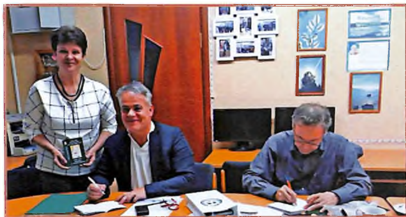
Сентябрь, 2018 г., сп Уньюган. Библиотека. «Первые Айпинские чтения», посвященные одному из удивительных людей Севера — писателю Еремею АЙПИНУ — яркому представителю народа ханты, незаурядному художнику слова, строгому хранителю традиций и ценностей Обского Севера. И выступление Доминика Самсона Норманда де Шамбурга, литературоведа, переводчика литературы, из Парижа (Франция) с докладом «Югра на реке Сене, или несколько слов парижанина о Е. Д. АЙПИНЕ». На фото Н. МАЛЫГИНА с гостями.