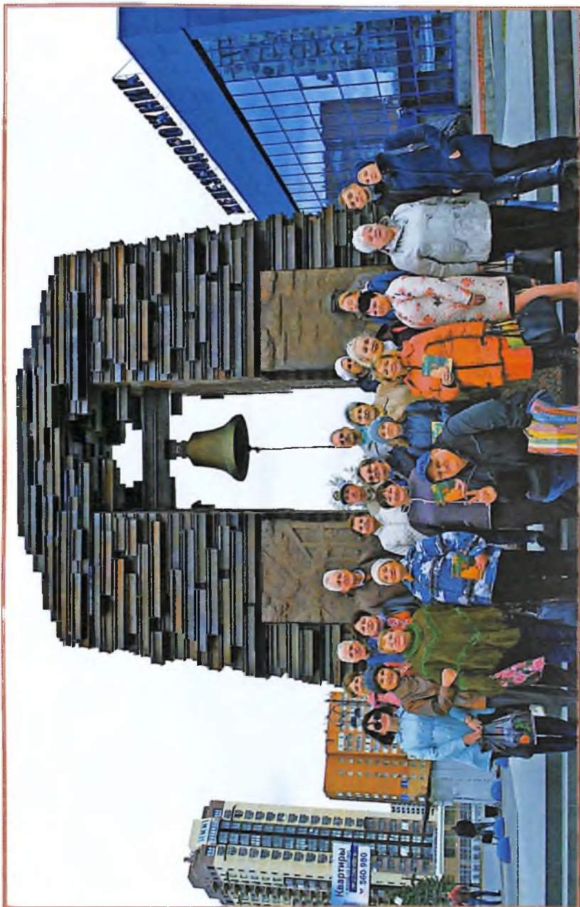
Мы около уникального памятника «Железнодорожникам фронта и тыла» (Был открыт в 2015 г.).