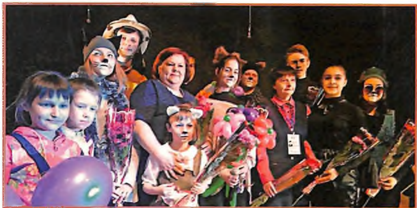
15.05.2018. Премьера спектакля «Кошкин Дом» в пгт Приобье. (К стр. 267-268).