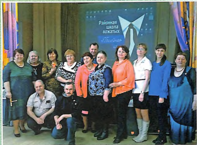
Апрель, 2018, пос. Приобье, Октябрьский район. Дом детского творчества. Презентация сборника «Серебряная Обь».