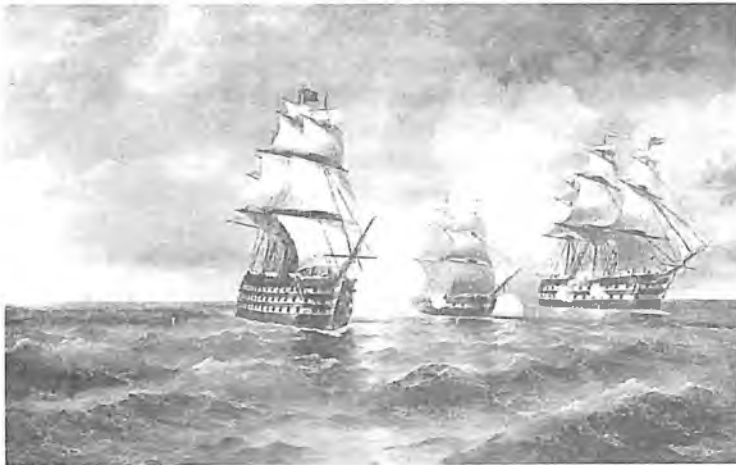
И. Айвазовский. Бриг «Меркурий» атакован турецкими кораблями

...Ступени широтой легли на склоне и вывели на высоту холма. Там замерла на кипельной колонне трирема, прочность взяв от чугуна. На вахту к ней сошли с Олимпа боги – к героям Крыма их корабль приплыл, чтоб прекратились беды и тревоги, чтоб подвиг славный в каждом сердце жил. На памятник легла всего лишь строчка – смысл всем понятен, краткостью суров: «Казарскому. В пример потомству». Точка. Озолотилась солнцем ёмкость слов.