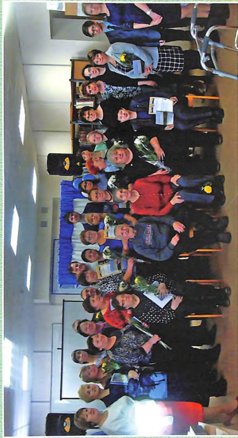
09.04.2018, пос. Приобье, Октябрьский район. Библиотека. Презентация книги «Серебряная Обь». На мероприятии присутствовали творческие люди Октябрьского района.