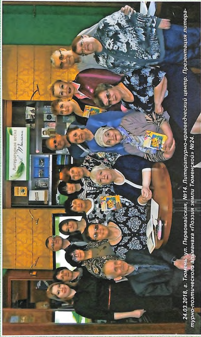
24.03.2018, г. Тюмень, ул. Первомайская, №14. Литературно-краеведческий центр. Презентация литературно-поэтического альманаха «Поэзия земли Тюменской» №24.