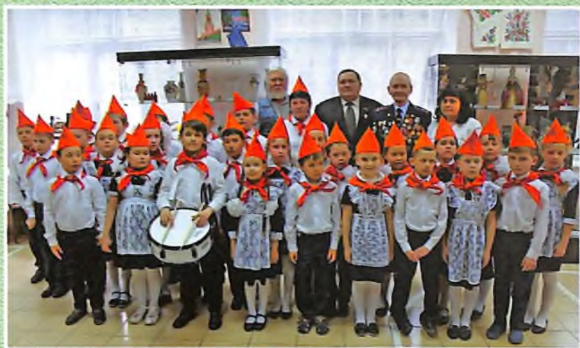
22.04.2018, село Ярково. СООШ. У кого что, а в Ярковской школе в этот день проходил приём 2-4-х классов в Российский союз пионеров.