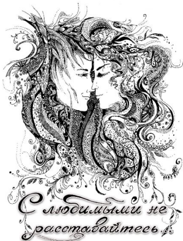
графика: Елена САВЕНОК, г. Омск

сумерки укрыли ее грусть, печаль и щемящую радость. Она взяла такси, ее ждали друзья, и она назвала адрес, водитель повез ее по вечернему сияющему разноцветными огнями городу. Сердце забилось чаще, и было такое ощущение, что он где-то рядом и чувствует, что она приехала. Это было невозможно, невозможно, прошло десять лет долгой разлуки, молчания, у каждого своей жизни, с радостями и печалью, и только любящее сердце не возможно было обмануть.