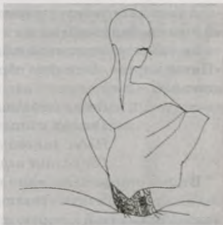
Рис. Марины Костоловой

Смотри-ка! Стрелки потеряли циферблат И чертят реку, дом и мокрый сад, И женщины скорбящий силуэт, И умирающий в ее руке букет, И свет луны на каменной стене, И чью-то тень в зашторенном окне, И снова женщину... Прощальный взмах руки. Все растворилось. Дома нет. Реки. Нет тени неразгаданной в ночи... Одна... И циферблата легкие лучи.