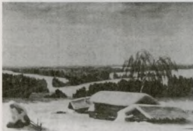
Художник Г. Токаев "Зимка".

В нашей любви к Пушкину – не только восхищение его поэзией, но и через его поэзию прикосновение к судьбе и тайне русской духовности, к тем чертам национального бытия, которые не всегда словом и выразишь. Мы понимаем и принимаем пушкинский поэтический мир не логически, все рассу-