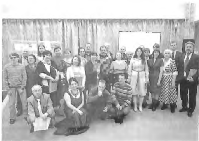
Выход альманаха «Зори Самотлора». Праздник