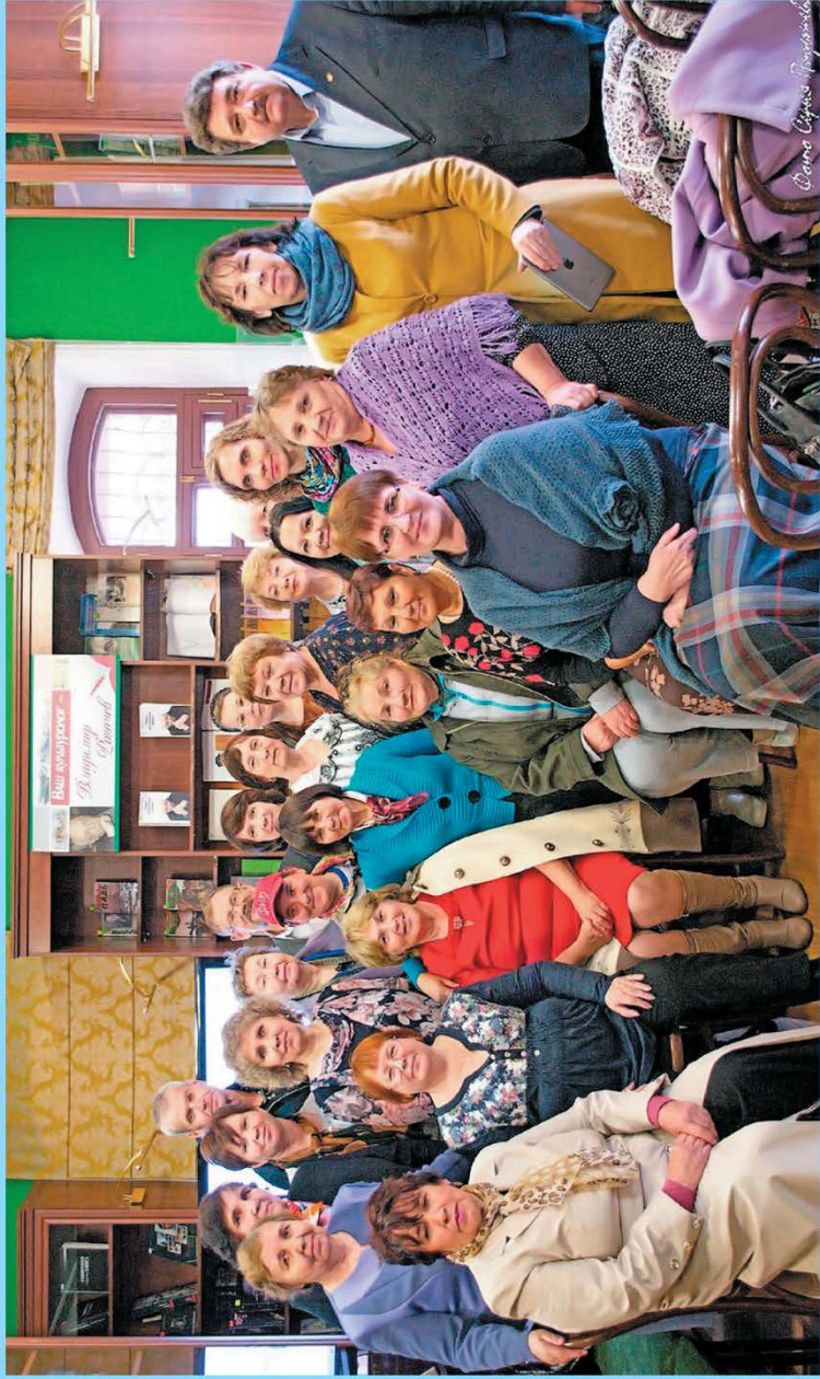
19.09.2015 г. Тюмень. Литературно-краеведческий центр. Презентация литературно-поэтического альманаха №12.