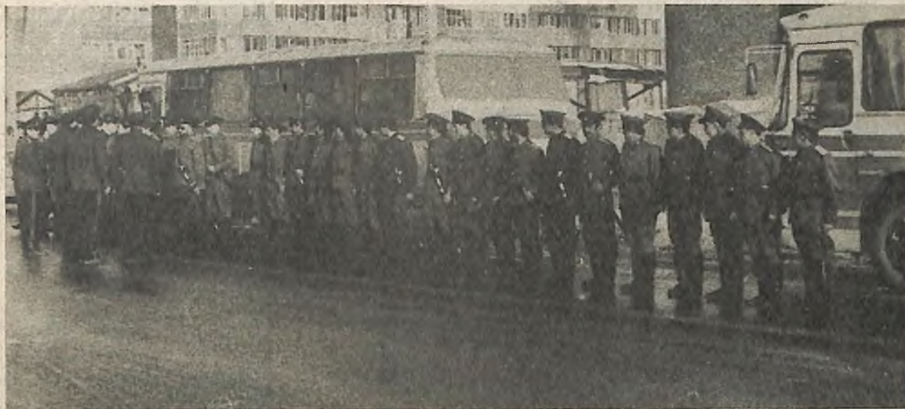
В заключение состоялся смотр сил казачьего отдела.